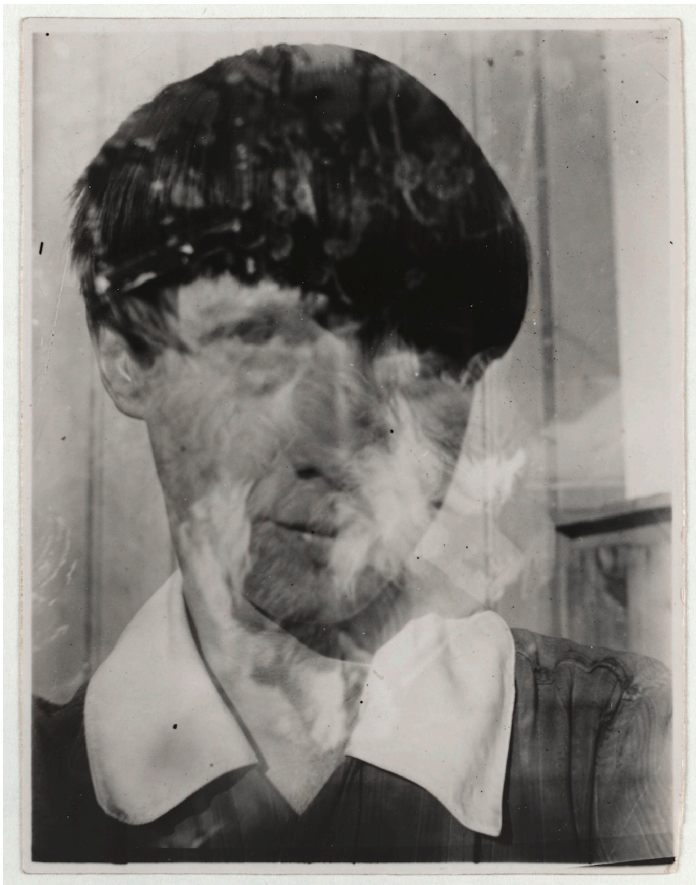
Без названия (Ханна Хёх. Портретная фотография с двойной экспозицией). Berlinische Galerie - Landesmuseum für Moderne Kunst, Fotografie und Architektur

Однозначно ответить на вопрос, кто именно изобрел коллаж, трудно. В этой технике работали кубисты, включая Пабло Пикассо и Жоржа Брака, конструктивисты, например, Александр Родченко, а также дадаисты. Среди берлинских дадаистов