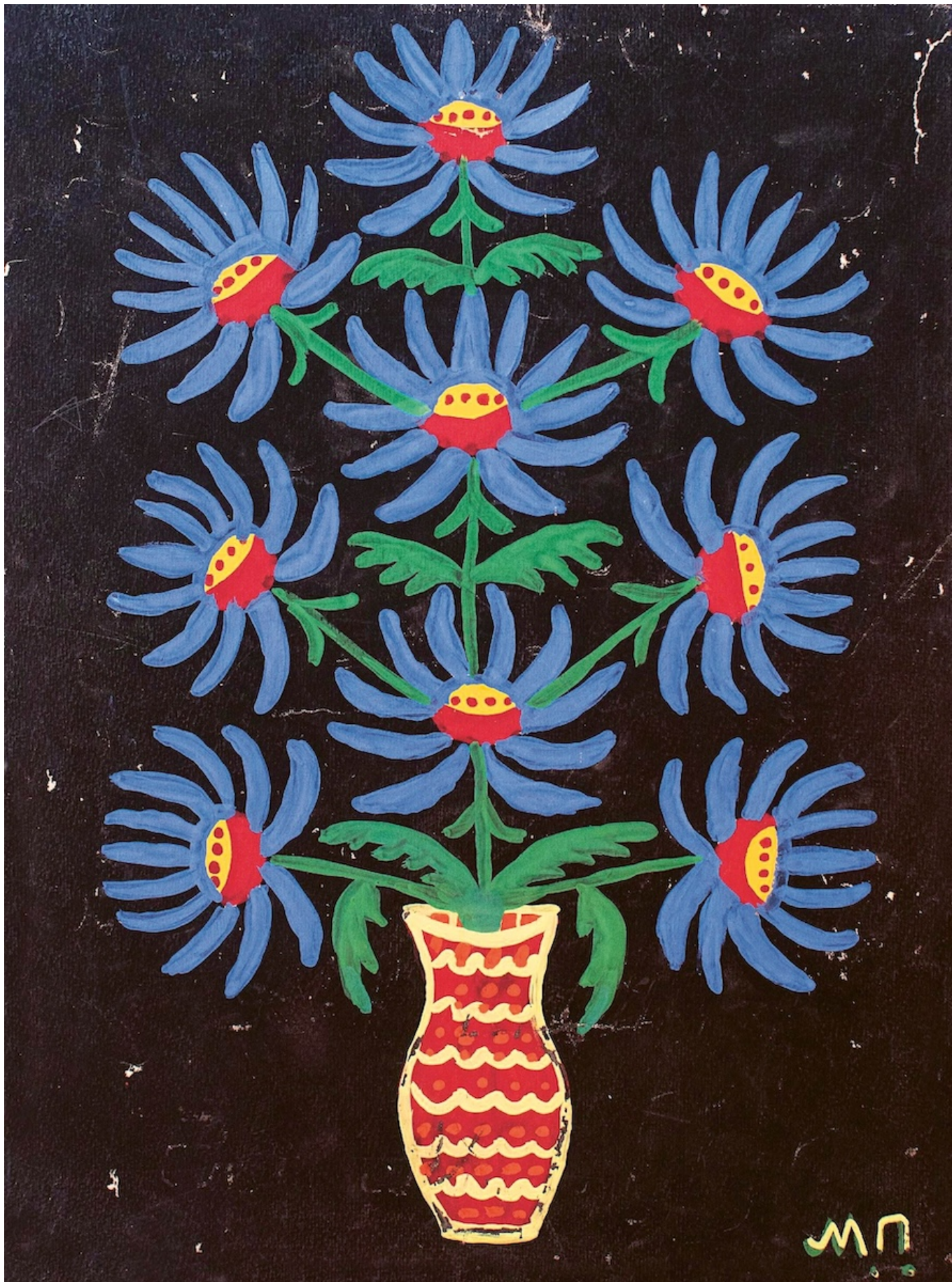
Мария Примаченко, Цветы на черном, 1960-1970-е гг. RODOVID-Gallery Collection (Kyiv).

В широком смысле под наивным искусством понимают направление примитивизма, к которому относится, среди прочего, творчество художников-самоучек. Наивное