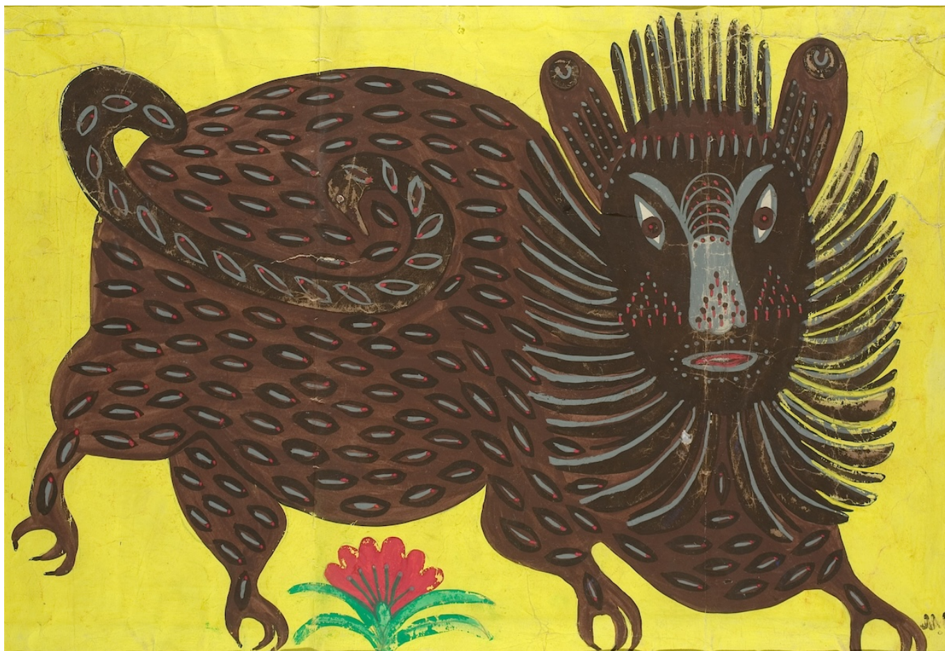
Мария Примаченко, Зверь войны, 1970-е годы. RODOVID-Gallery Collection (Kyiv), © 2023 by Maria Prymachenko Family Foundation

Расположенный в поселке Иванков музей, где хранились некоторые работы художницы, был разрушен 26 февраля 2022 года – на третий день развязанной Россией войны. Жители деревни смогли спасти картины, буквально вынеся их из огня – одна из спасенных работ была показана на Биеннале в Венеции в прошлом году. Это трагическое событие привлекло внимание всего мира к украинской художнице, а написанная ею картина «Голубь расправил крылья и просит мира» стала одним из главных современных антивоенных символов и олицетворением надежды на мир. Сама же выставка названа в честь другой картины Примаченко – «Зверь войны». Чудовище с колючими глазами, когтистыми лапами и красной щелью вместо рта снова вернулось, чтобы сеять хаос, но нет сомнений в том, что оно будет повержено – голубь мира в конце концов одолеет это страшное чудовище.