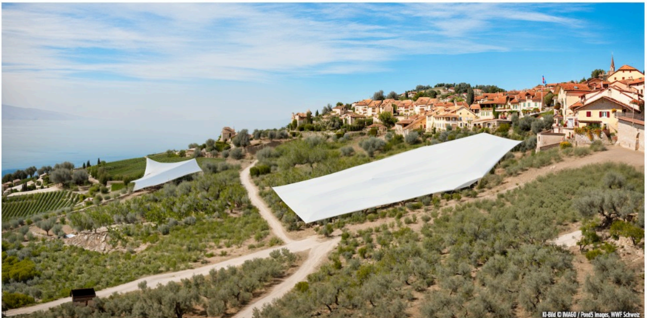
Виноградники Лаво

Акция WWF приурочена к федеральным выборам и призвана привлечь внимание общественности к важности избрания депутатов, заботящихся о защите окружающей среды. В частности, информацию о приверженности партий экологическим вопросам можно получить на сайте ecorating.ch .