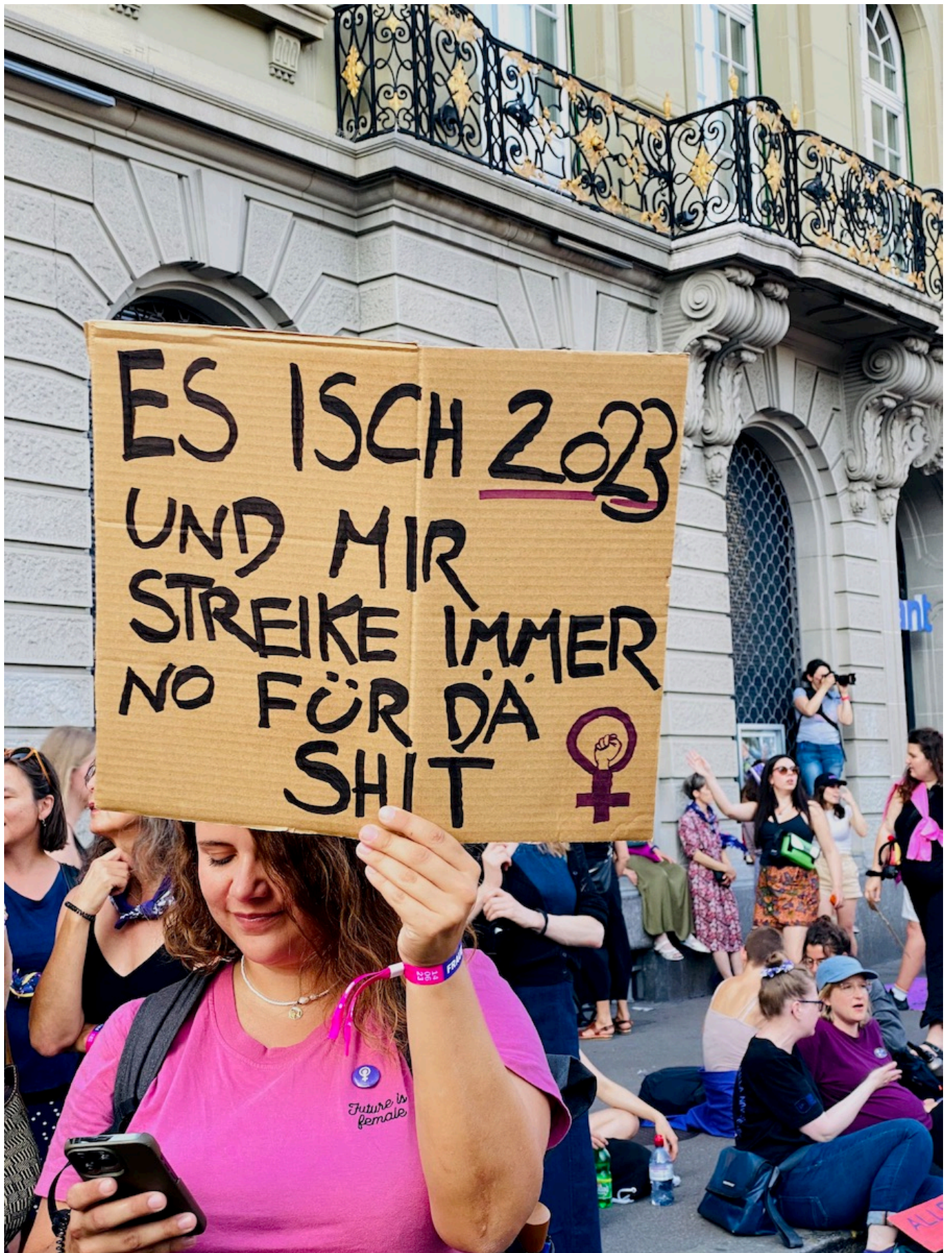
"Идет 2023 год, а мы все еще протестуем против одних и тех же вещей".

Отдельные дебаты по вопросам равенства прошли 14 июня и в Национальном совете. Из восьми обсуждавшихся предложений были приняты три: призыв к прекращению