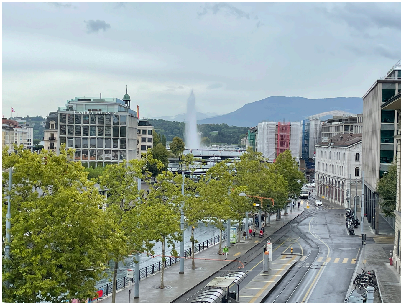
Вид из окна офиса Pilet&Renaud

Но что же такого интересного в профессии, которая, на поверхностный взгляд многих, состоит лишь в купле-продаже домов и квартир? «Купля-продажа недвижимости – лишь малая часть того, чем занимается наше современное агентство, – объясняет Аликс Барбье-Мюллер. – Гораздо больше времени занимают контакты с владельцами и съемщиками, кадровые вопросы (сегодня здесь работают 110 человек), а также масштабный и долгосрочный проект постепенного энергетического обновления находящихся в нашем управлении зданий с учетом нынешних требований. Цель ясна и как нельзя более актуальна – максимально сократить потребление энергии не только в «готовом», нормально функционирующем здании, но и во время ремонтных работ, о чем мало кто задумывается».