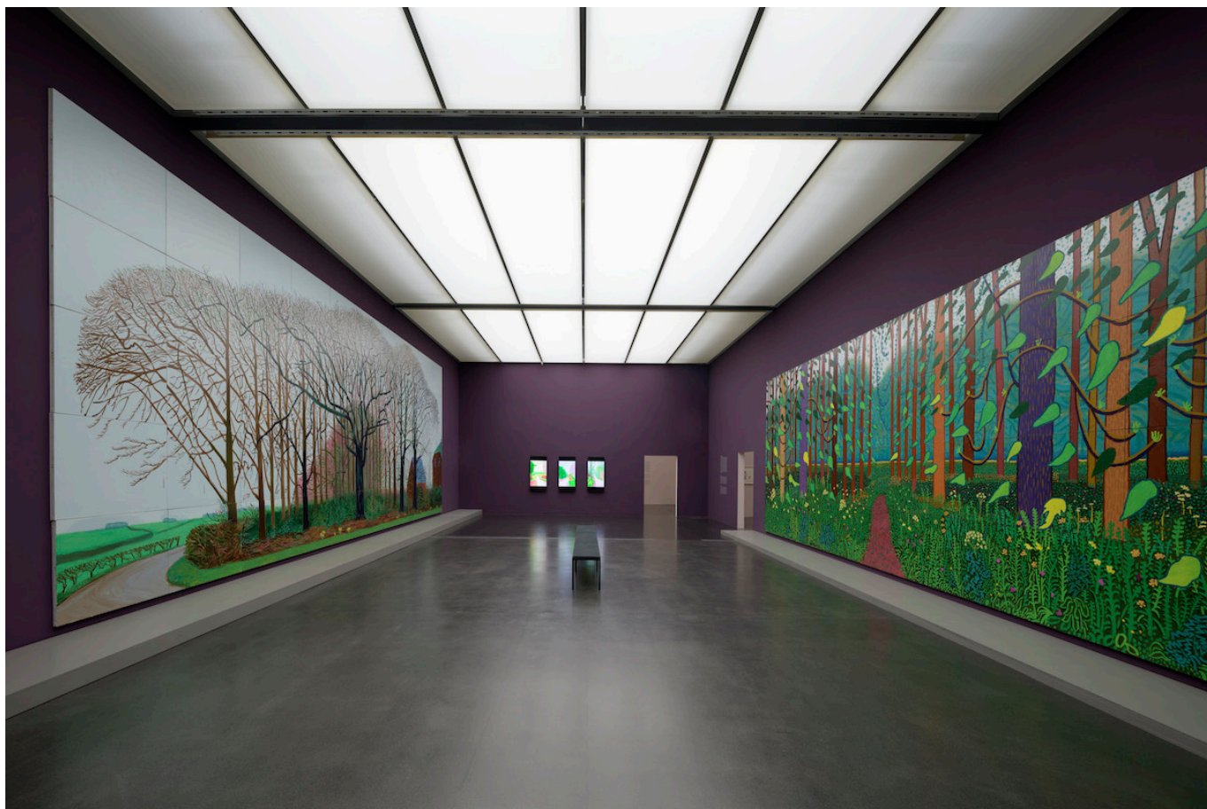
David Hockney, Moving Focus, Kunstmuseum Luzern, 2022

Творчество Дэвида Хокни не стоит на месте. Он постоянно пробует новые стили и бросает вызов нашим зрительским привычкам, экспериментируя с живописью, рисунком, гравюрой, акварелью, фотографией, а также используя технические средства, в том числе факсимильный аппарат и компьютерные программы. Так, на восьмом десятке лет художник освоил приложение Brushes. Его более поздние рисунки, написанные на iPad, представлены на выставке в виде видеоанимации.