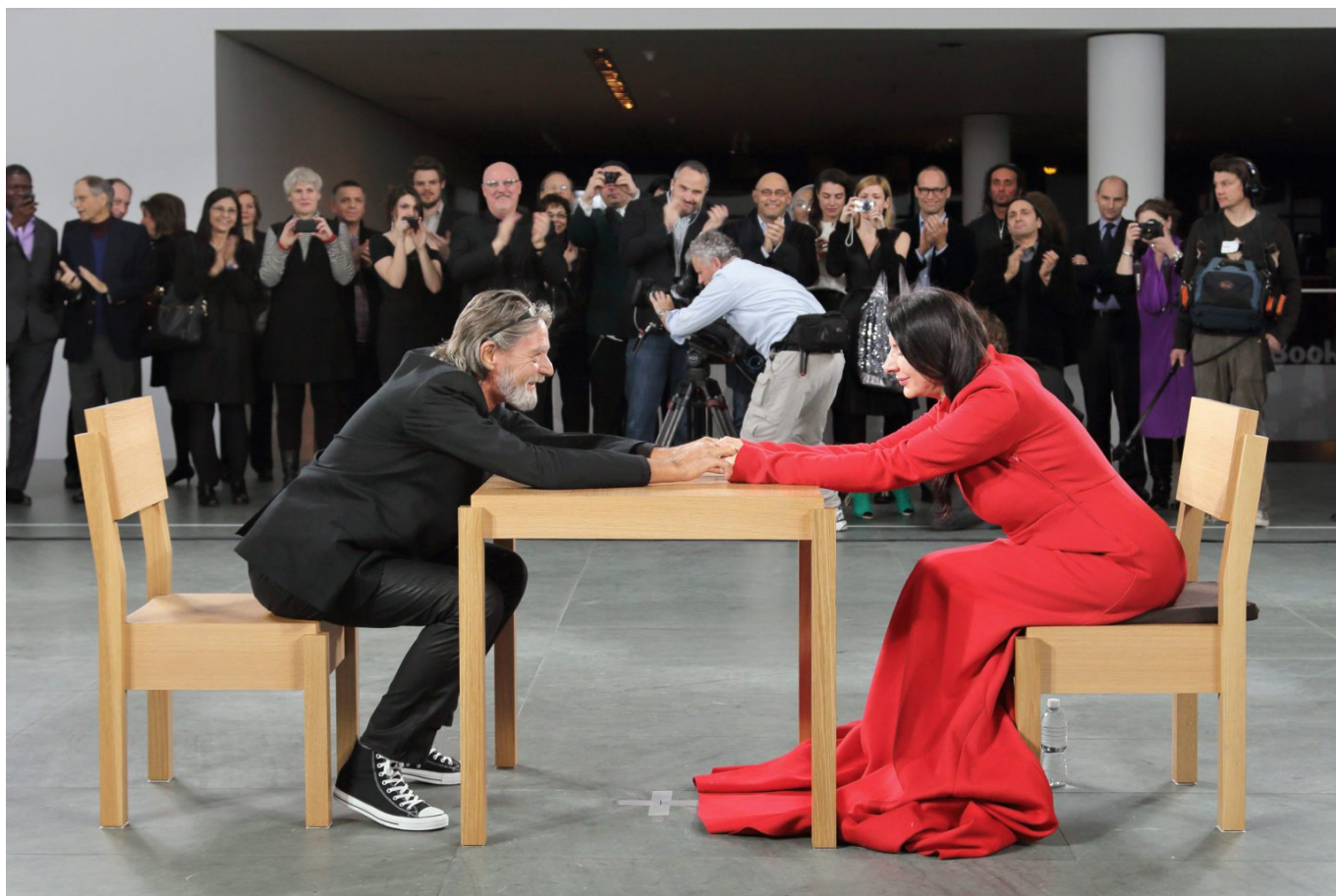
Марко Анелли. "В присутствии Марины Абрамович", 2010 г.

МоМА, а летом 2017-го, спустя 30 лет после расставания, и вообще помирились – прямо на сцене датского Музея современного искусства «Луизиана», где проходила крупнейшая выставка Марины Абрамович в Европе на тот момент. По-настоящему они расстались навечно 2 марта 2020 года, в день кончины Улая. Впрочем, и эта «окончателность» по-прежнему под вопросом.