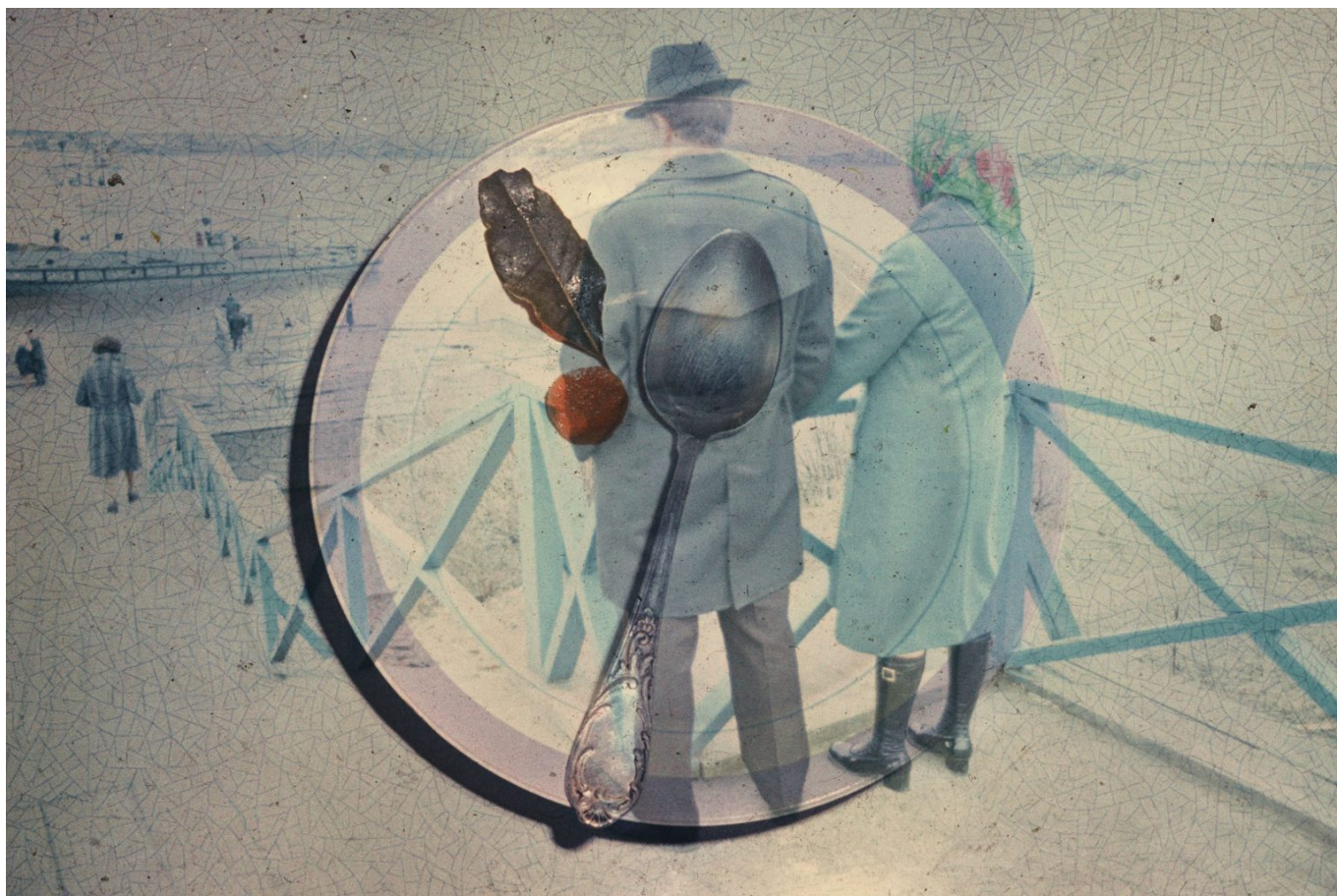
Борис Михайлов. "Вчерашний сэндвич"