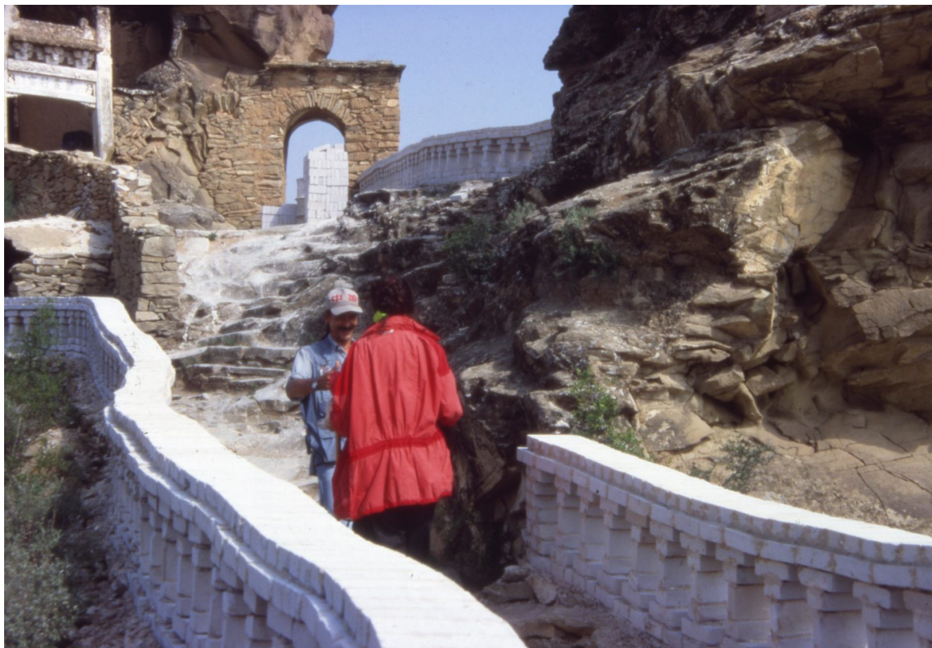
Встреча Марины Абрамович и Улая на Великой Китайской стене, 1988 г.

Два года назад Наша Газета рассказывала о сделанной в 1981 году серии полароидных фотографий в четырех частях Modus Vivendi Марины Абрамович и Улая, которая была выставлена в Художественном музее Берна. Работа, которую теперь увидят посетители Images Vevey, занимает особое место в творчестве обоих художников. Марина и немецкий художник-концептуалист и перформансист Улай познакомились в 1976 году в Амстердаме и быстро поняли, что их объединяет идея «коллективного существа», которое они сами называли как «Другое».