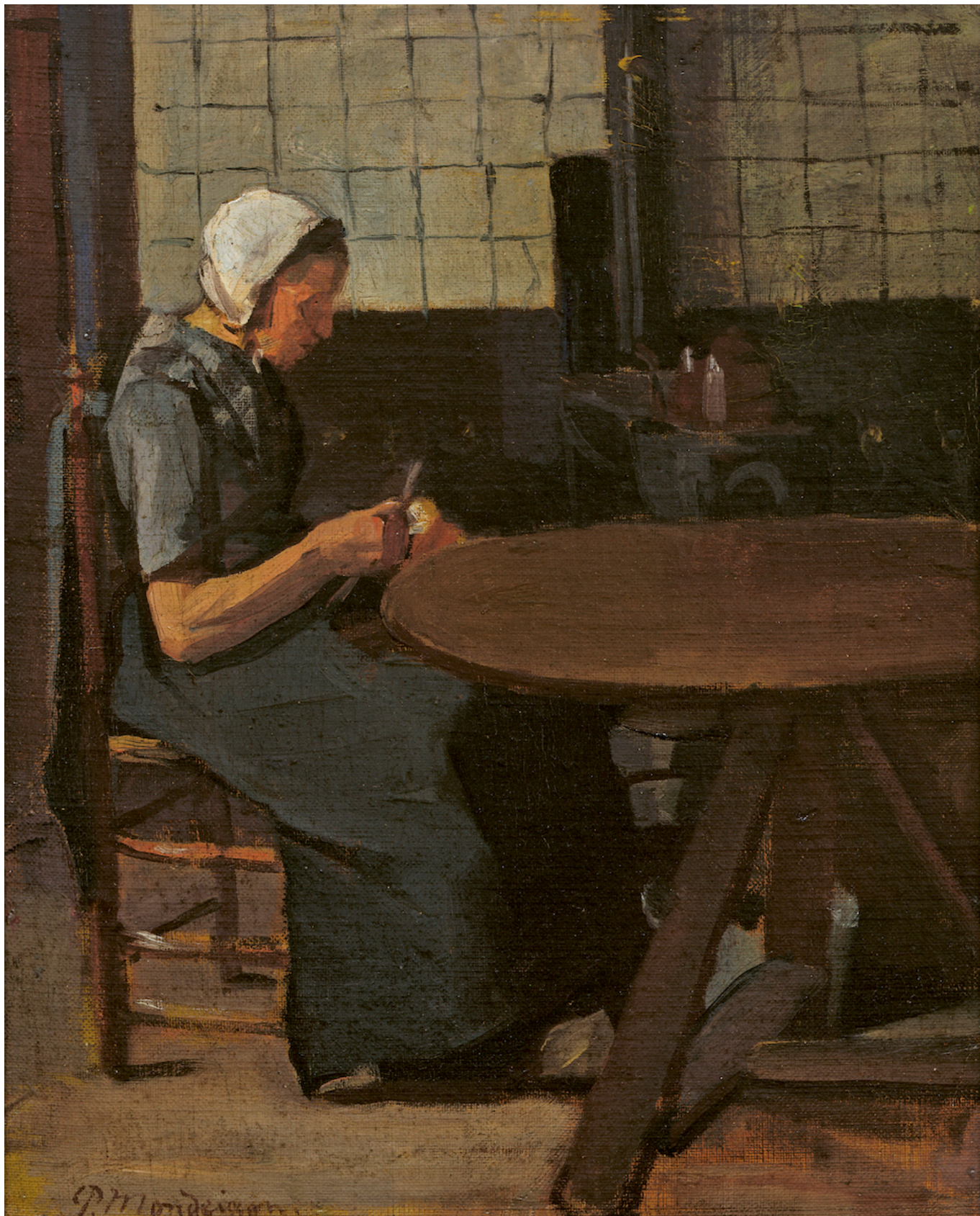
Пит Мондриан. Женщина с веретеном, ок. 1893-1896 гг. Предоставлено галереей Pace. © 2022 Mondriaan/Holtzman Trust.

В начале 1910-х годов Мондриан увлекся цветом. На его полотне «Красное облако» 1907 года запечатлен волшебный момент, когда заходящее солнце окрашивает облако в ярко-красный цвет, в то время как небо остается ярко-синим. Эта картина принадлежит к группе работ, которые Мондриан писал в сумерках, когда оттенки быстро меняются. На автопортретах 1908 года он также изображает себя в сумерках