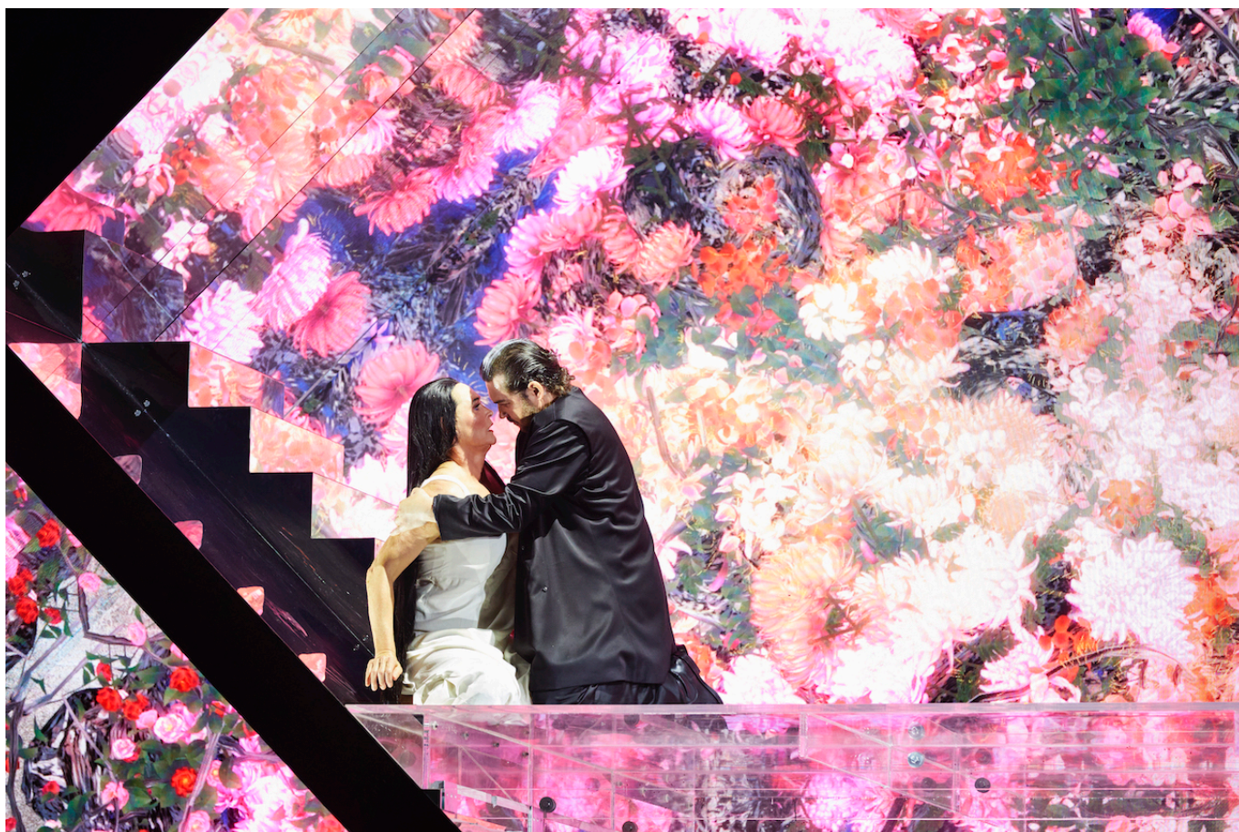
Великолепный финал спектакля

Но главное – любовь торжествует, а о несчастном отце Калафа и не менее несчастной Лиу, которые пожертвовали собой ради спасения претендента на китайский трон, никто и не вспомнит.