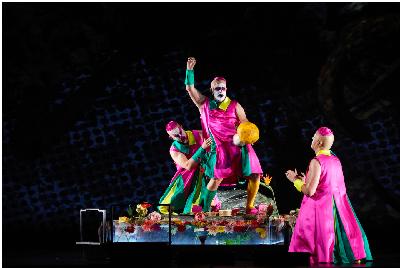
Три министра с наглядными пособиями