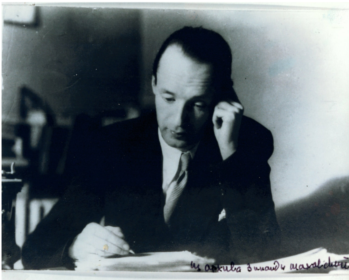
Молодой Владимир Набоков