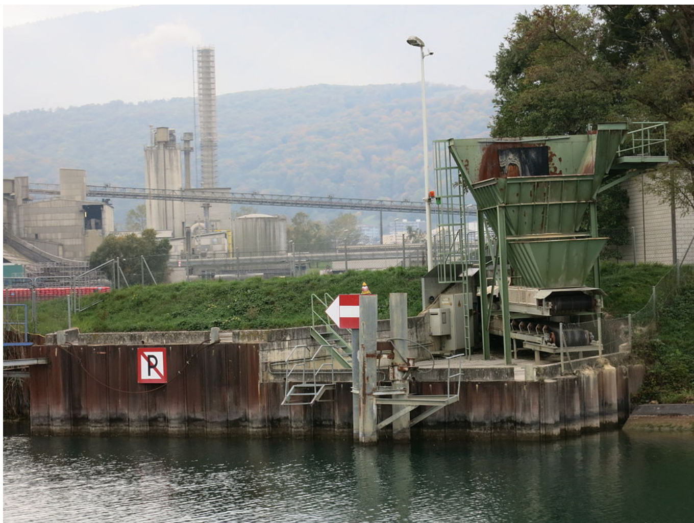
Нефтеперерабатывающий завод в Крессье.

более половины сырой нефти (50,8%), то затем эта доля начала снижаться, составив в 2020 году не более 6%. В ноябре сырая нефть в Швейцарию поступала из Нигерии, Ливии, США, Казахстана и Алжира, проходя через единственный швейцарский нефтеперерабатывающий завод в Крессье (кантон Невшатель). В последние годы количество импортируемых нефтепродуктов в два-три раза превышало количество сырой нефти. Бензин, мазут, керосин перерабатываются, как правило, в Германии и Нидерландах, поэтому трудно определить, где было добыто сырье. В Конфедерации эти нефтепродукты в основном используются в транспортной сфере и для ... обогрева домов. Согласно статистике, мазут остается основным источником отопления в одной трети швейцарских зданий, что является рекордным показателем в Европе и вообще кажется удивительным фактом для Швейцарии, которая часто позиционирует себя как заботящуюся об окружающей среде страну.