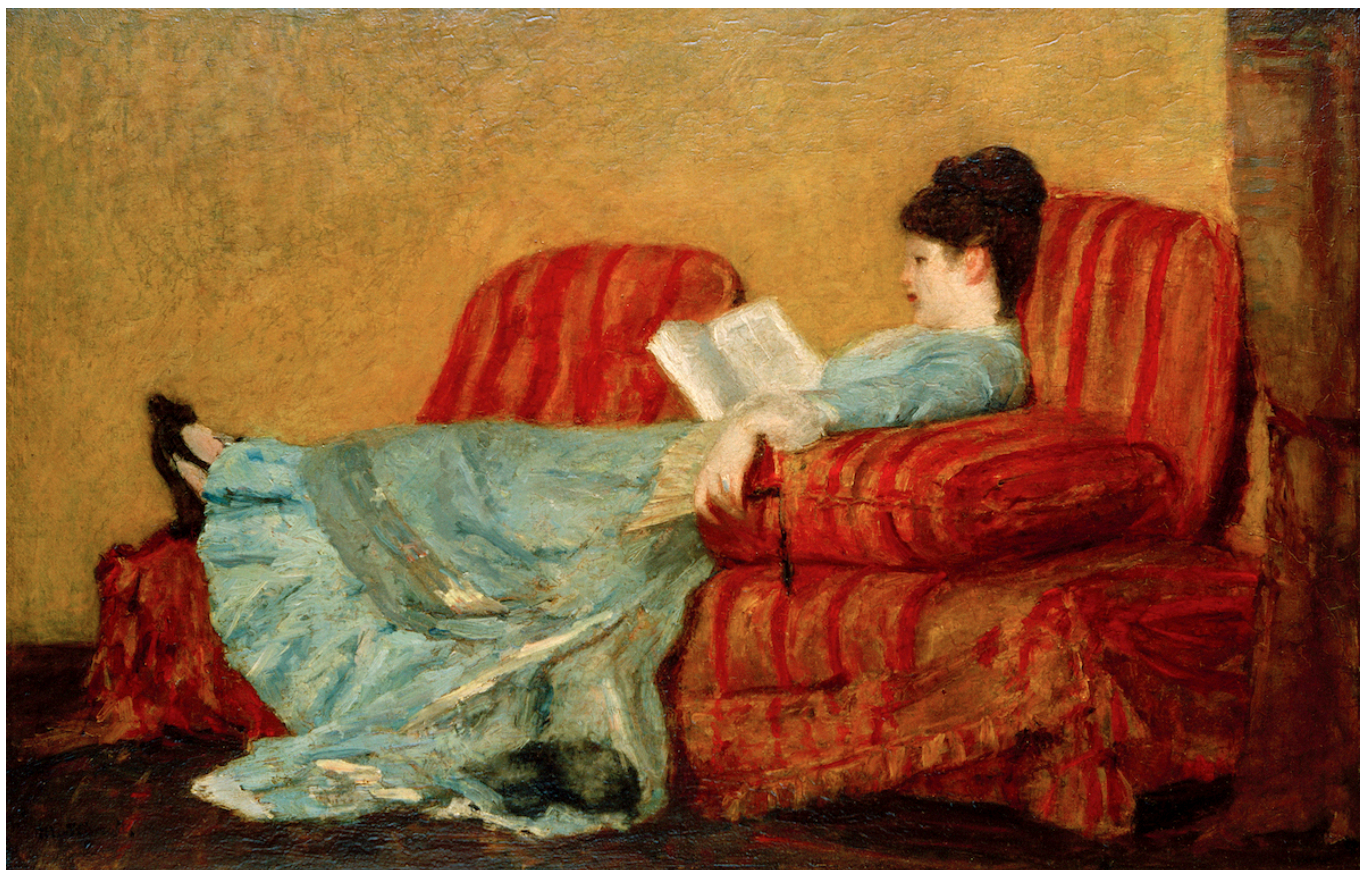
Mary Cassatt Young Lady Reading (Jeune femme lisant), 1878 Huile sur bois, 40,3 x 63,2 cm Collection de Diane B. Wilsey

Author: Зарина Салимова, Базель , 21.09.2021.