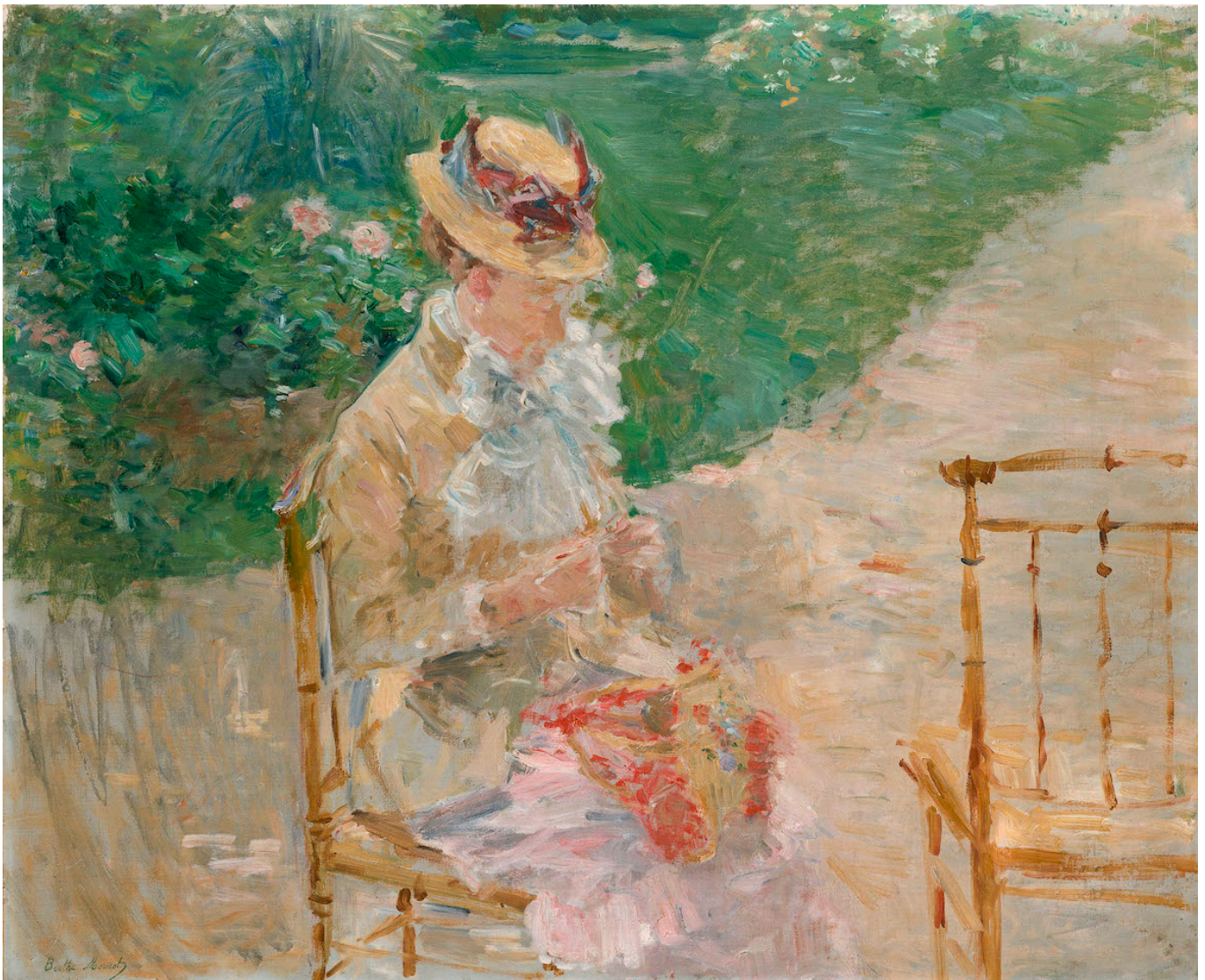
Berthe Morisot. Jeune femme cousant au jardin, ca. 1883 Huile sur toile, 50,2 x 60 cm The Metropolitan Museum of Art, New York, Legs de Miss Adelaide Milton de Groot (1876–1967), 1967

В последнее время женский вклад в искусство становится предметом углубленного изучения специалистов, и ведущие музеи мира посвящают выставки исключительно художницам. Наверное, это происходит во многом благодаря изменившейся социальной повестке, вынесшей на первый план проблемы, с которыми сталкивается современная женщина: от сексуальных домогательств и насилия до права распоряжаться собственным телом и судьбой. Не стала исключением и Швейцария, где «женский» вопрос тоже стоит остро. Напомним, что в этом году Конфедерация отмечает 50-летие введения женского избирательного права, а буквально в эти дни швейцарские депутаты (под возгласы протестующих на Федеральной площади) обсуждают детали реформы, предусматривающей увеличение пенсионного возраста для женщин. На фоне происходящего открывшаяся на днях в базельском Фонде Бейлера выставка кажется особенно актуальной – в центре экспозиции помещены работы женщин-художниц, чье творчество занимает видное место в истории современного искусства с 1870 года до наших дней.