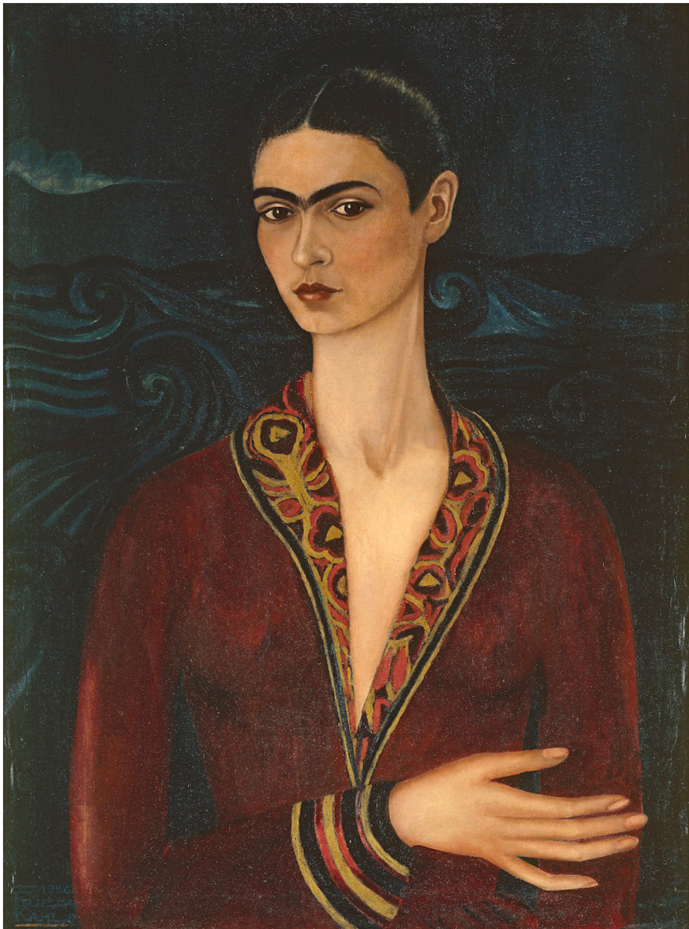
Frida Kahlo Autorretrato con traje de terciopelo (Self-Portrait dans une robe en velours), 1926 Huile sur toile, 79,7 x 60 cm Collection privée; © Banco de México Diego Rivera & Frida Kahlo Museums Trust, México D.F. / 2021, ProLitteris, Zurich