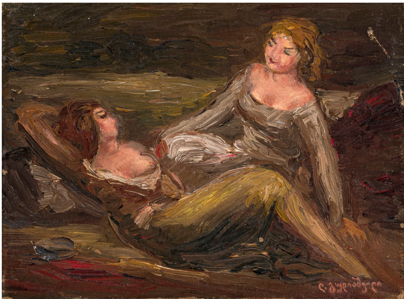
Лад Гудиашвили (1896-1980), Разговор, масло на холсте, подпись, 19х26 см

Лад (Владимир) Давидович Гудиашвили родился в 1896 году в Тифлисе, а умер в 1980-м в Тбилиси. В отличие от Бажбеука-Меликова, признание пришло к нему при жизни – этот художник-живописец, график, монументалист и педагог был удостоен званий Народный художник СССР (1972) и Герой Социалистического Труда (1976) и стал первым лауреатом Государственной премии Грузинской ССР им. Руставели, в 1965 году.