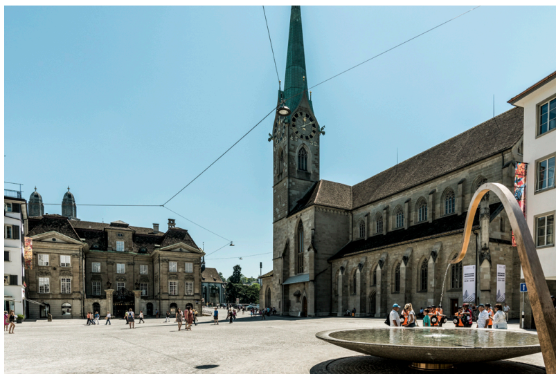
Цюрих зовет

Что касается перелета в Конфедерацию, то речь идет о путешествии в самолете авиакомпании SWISS в эконом-классе. 6 проездных Swiss Travel Pass дадут право на неограниченное количество поездок на поездах, автобусах и кораблях по всей Швейцарии.