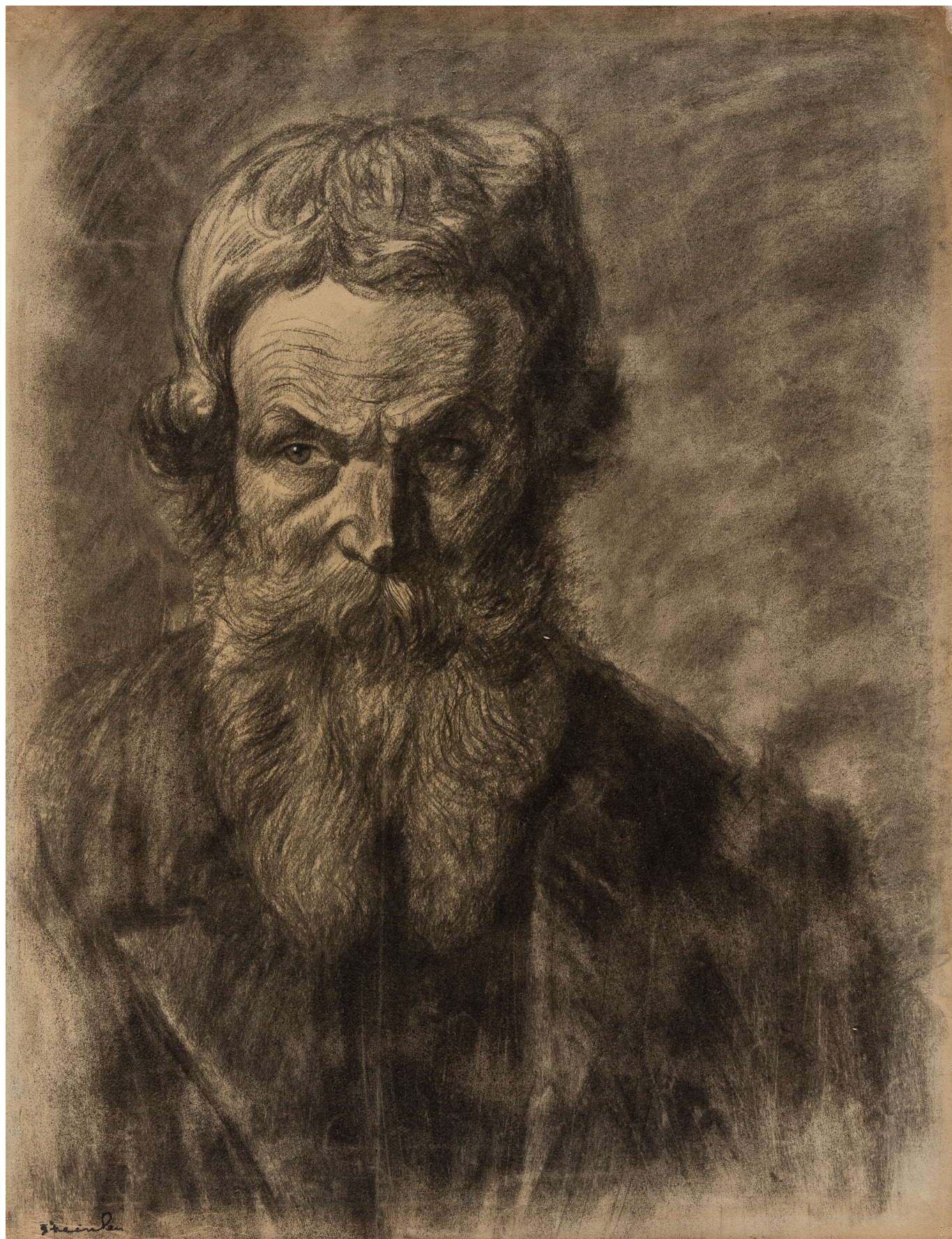
Теофил Александр Стейнлен, "Портрет Льва Толстого", ок. 1905 г., Musée Jenisch Vevey

ощущение полного погружения в контекст и вызывает непреодолимое желание бросить все и бежать смотреть – но уже не «просто так», а со смыслом, обращая внимание на детали, которые могли бы остаться незамеченными.