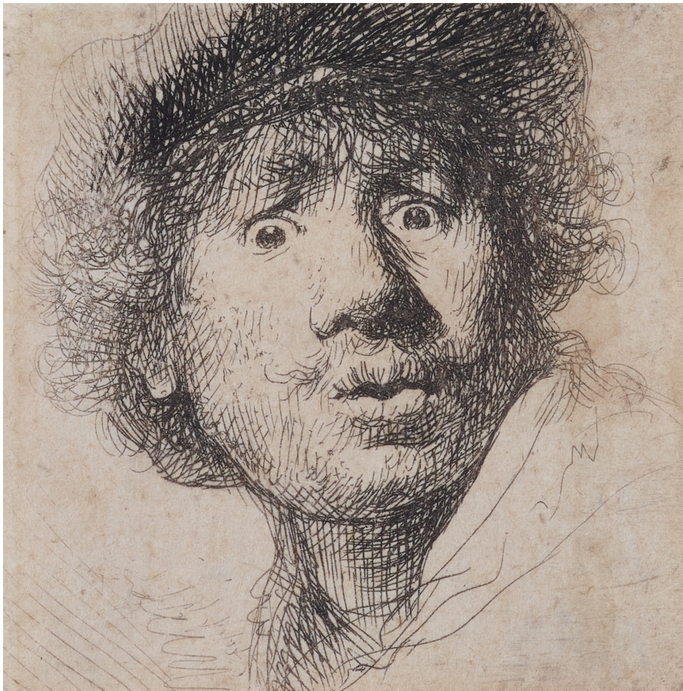
Рембрандт (1606 - 1669), "Голова мужчины в берете", или Рембрандт с дикими глазами, 1630 г. Musée Jenisch Vevey - Cabinet cantonal des estampes, Collection du Musée Alexis Forel