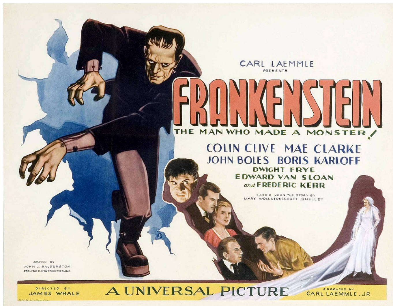
Постер фильма «Франкенштейн»