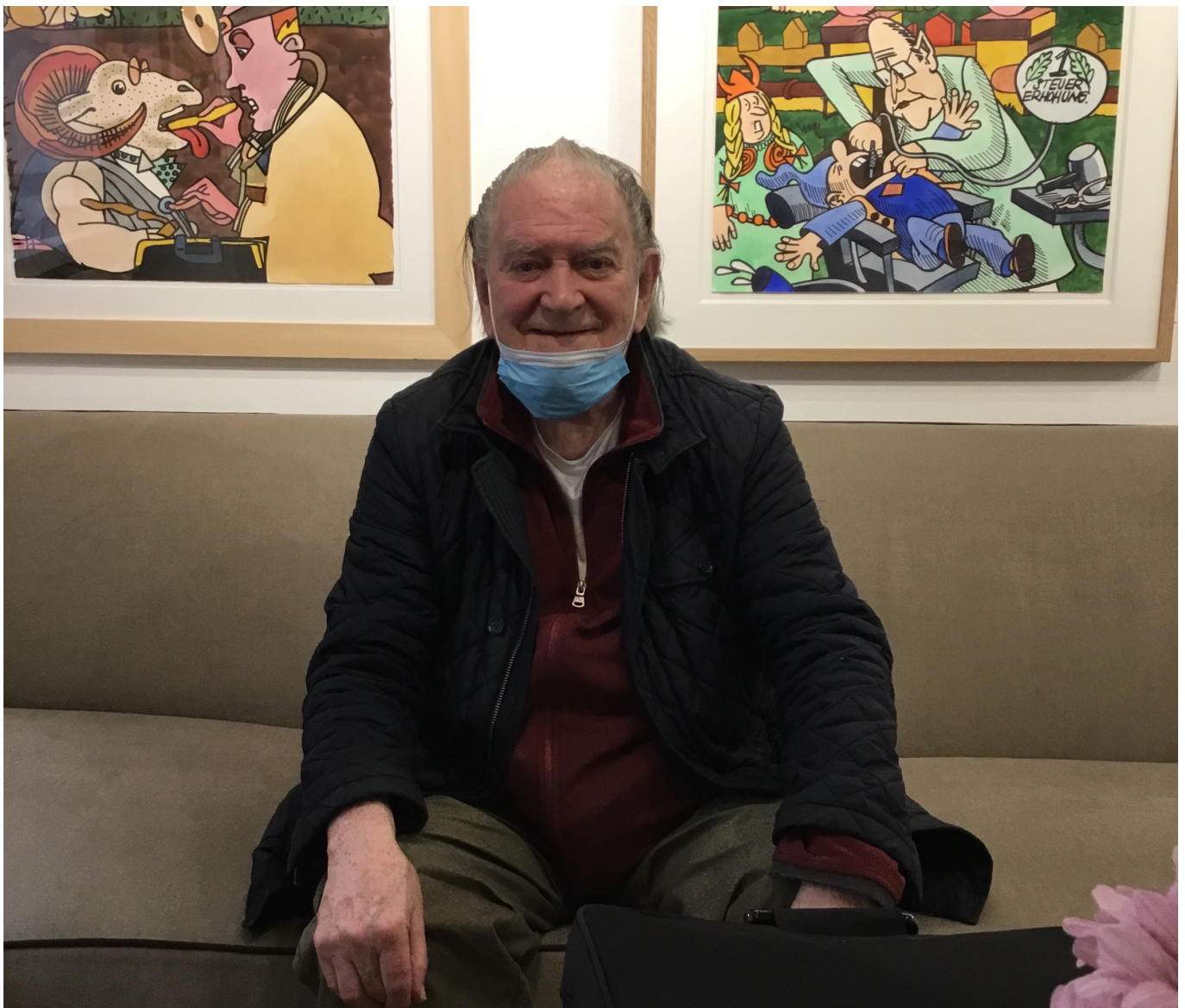
Художник Эрро на вернисаже в Женеве, 20 мая 2021 г.