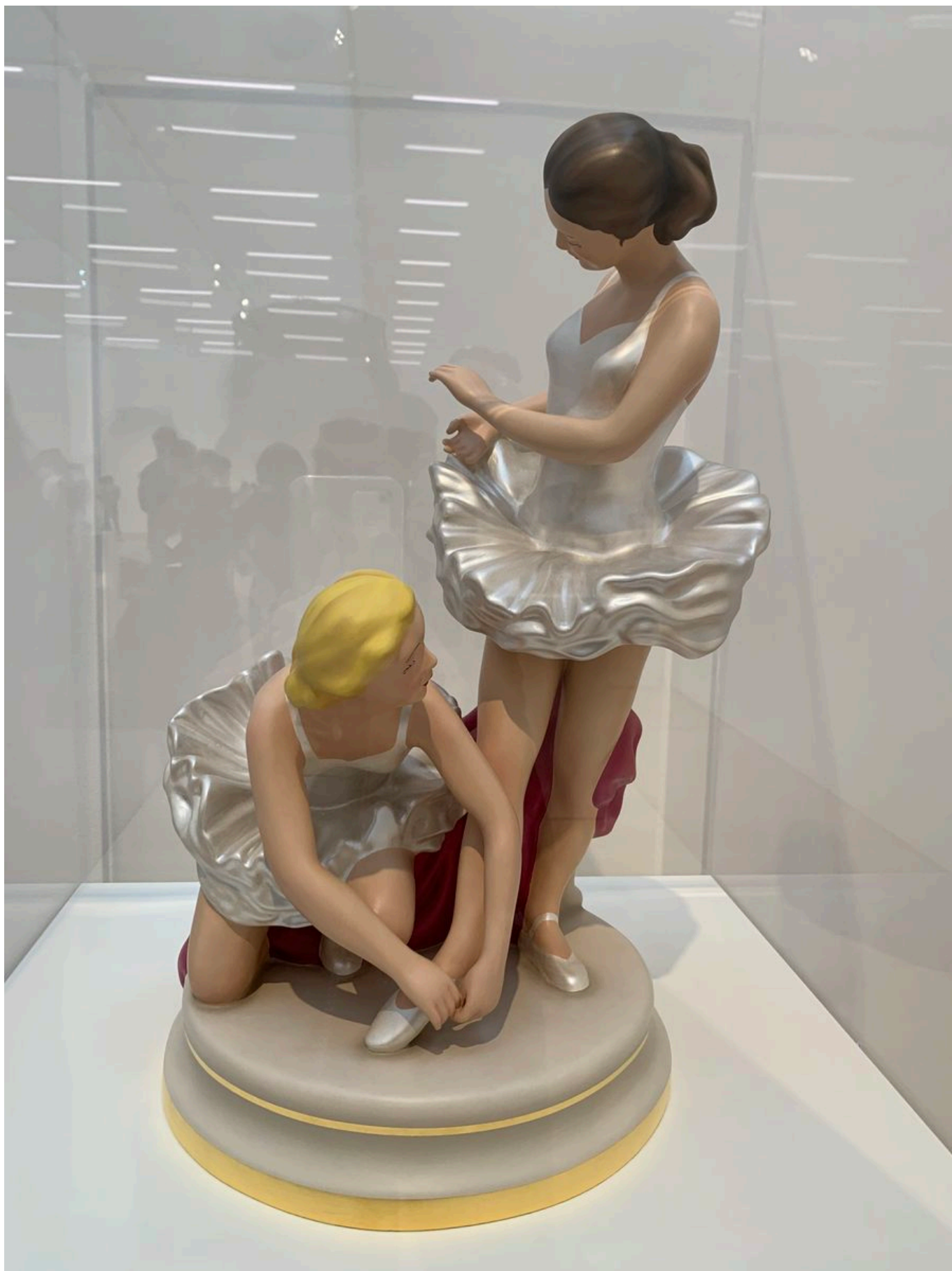
Джефф Кунс. "Балерины", 2017 г. Частная коллекция.

В первом, «Уловить движения», представлены творения Эдгара Дега: одна из его знаменитых «Танцовщиц», вдохновленная балеринами Парижской оперы, «перекликается» с «Балеринами» Джеффа Кунса, навеянными фарфоровыми