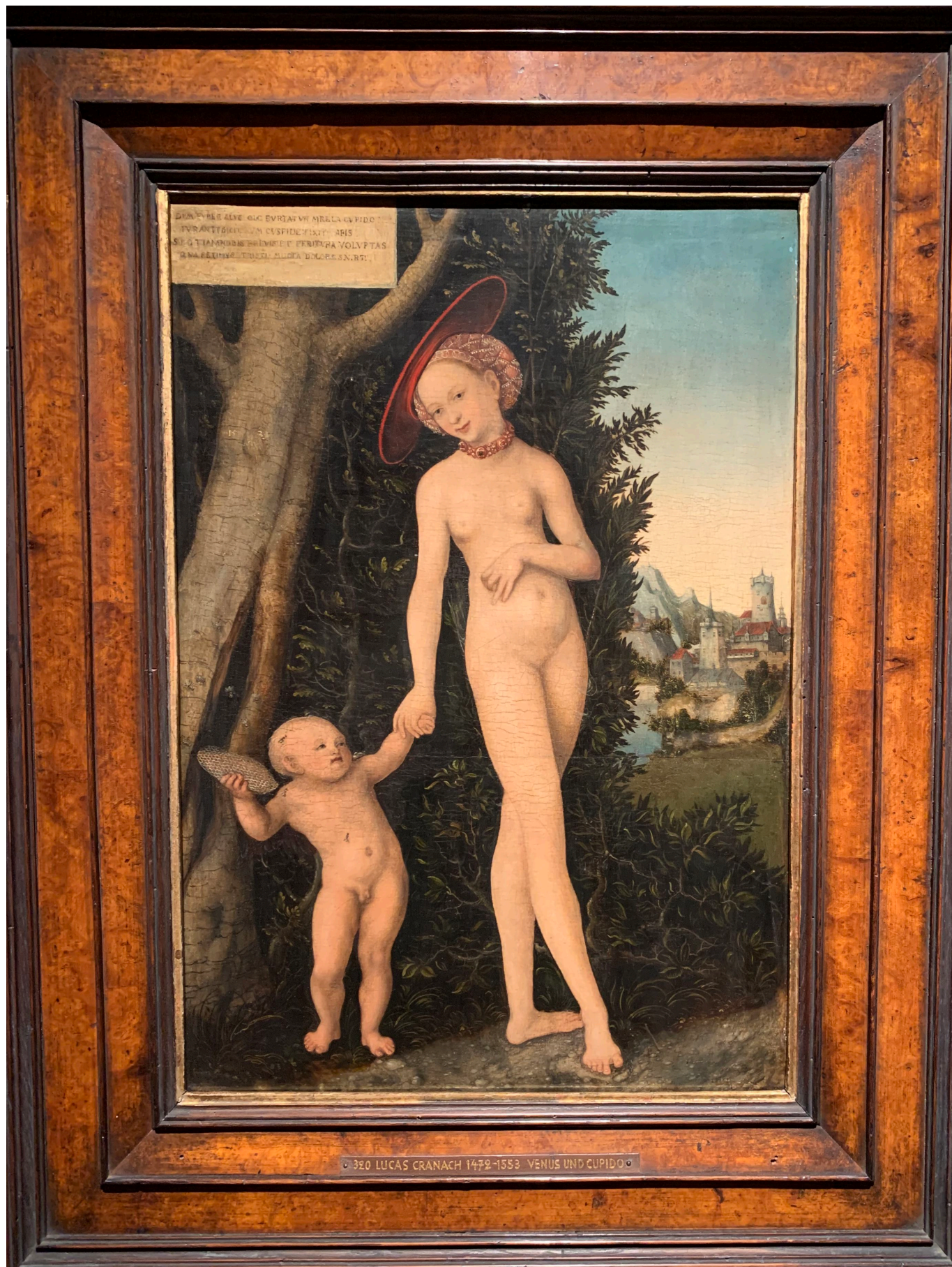
Лукас Кранех Старший. Венера и Амур, ворующий мёд, 1531 г. ((Toulouse, Fondation Bemberg)

Венера и Амур были частыми «гостями» его полотен, одно из которых, созданное в 1509 году, хранится в Государственном Эрмитаже в Санкт-Петербурге. Работа,