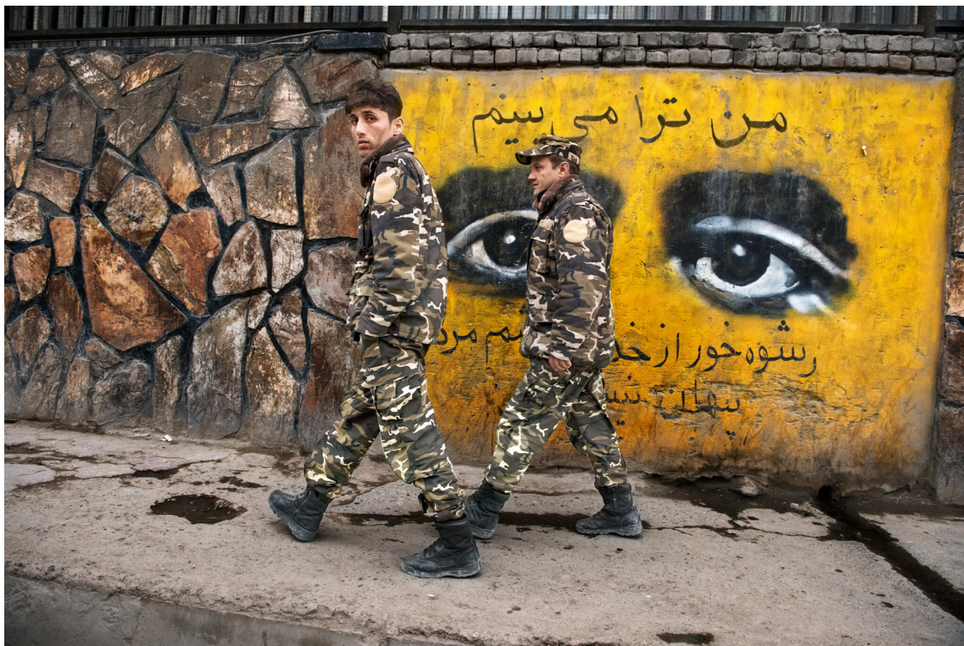
Musée Barbier-Mueller.