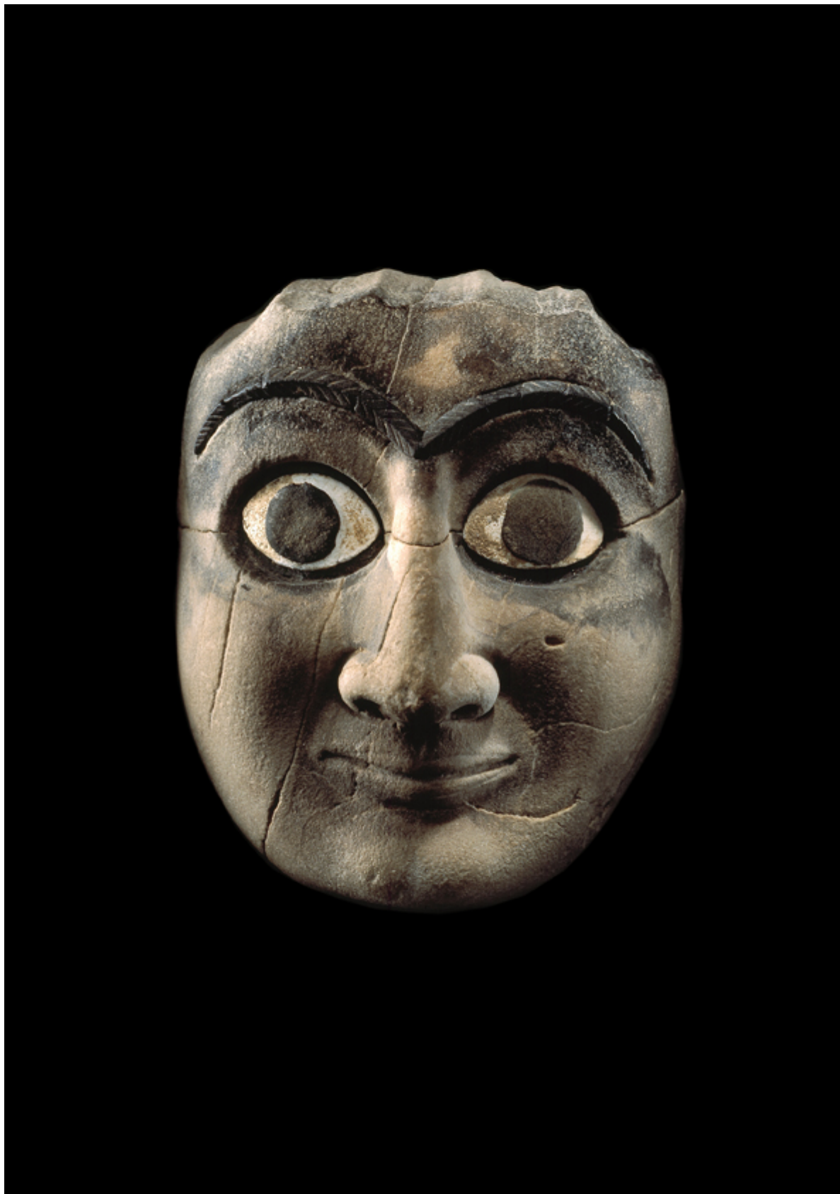
Маска, вероятно с востока Сирии. Середина 3 тысячелетия до н.э. Musée Barbier-Mueller.

«Три маленькие фигурки в красных одеяниях буддистских монахов поднимаются по ступеням ступы в Мингуне, в Мьянме, бывшей Бирме. Они кажутся совсем крохотными по сравнению с массивной кирпичной конструкцией, причудливо выцветшей в разных оттенках коричневого цвета под влиянием непогоды и эрозии. Зеленые лианы и пышно разросшийся мох завоевали полуразрушенные ступени, а в