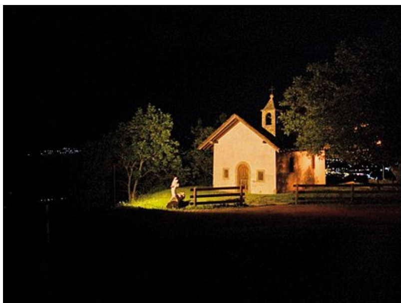
Часовня святого Себастьяна

Стоит спуститься чуть ниже, в поселок Безон (Beuson), и здесь, недалеко от автобусной остановки, можно увидеть еще одно архитектурное чудо – каменную часовню святой Агаты (Sainte-Agathe). История ее насчитывает не одну сотню лет. Когда-то здесь пролежала дорога, ведущая из высокогорных поселков в долину Роны. Для охраны пастухов и крестьян от превратностей крутых склонов еще в древности здесь возвели часовню, посвященную Святому Бернару из Ментона (XI век), создателю знаменитого приюта на перевале, названном позднее его именем. В 1783 году жители Безона решили сменить название часовни и посвятили ее святой мученице Агате, пострадавшей в III веке в Катании на Сицилии, в период гонений на христиан при императоре Деции (в православной церкви она также почитаема и известна под именем святой Агафии). Валезанцы верили, что пряжа, освященная в день памяти святой, а затем зашитая в одежду, помогает отогнать злых духов, а хлеб и соль, освященные в этот день, кушали во время болезни и даже давали занемогшим домашним животным.