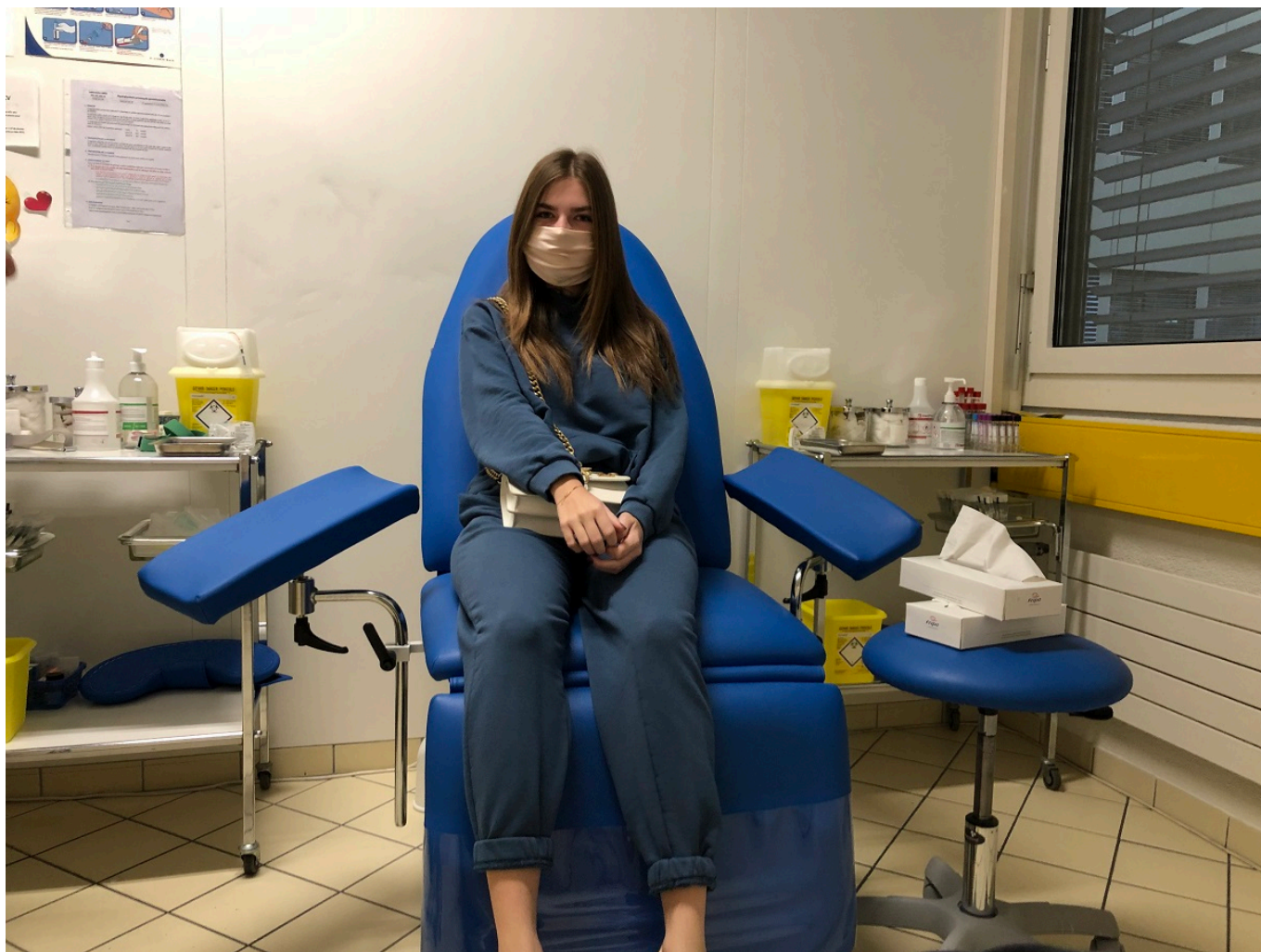
Юная пациентка в Женеве готовится сдать тест на Covid-19.