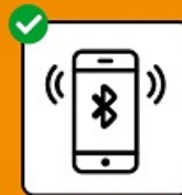
Interrompre les chaînes de transmission avec l'application SwissCovid.