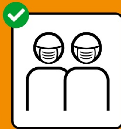
Porter un masque si on ne peut pas garder ses distances.