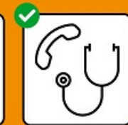
Se rendre chez le médecin ou aux urgences seulement après avoir téléphoné.