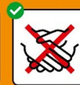
Ne pas se serrer la main.