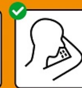
Tousser et éternuer dans un mouchoir ou dans le creux du coude.