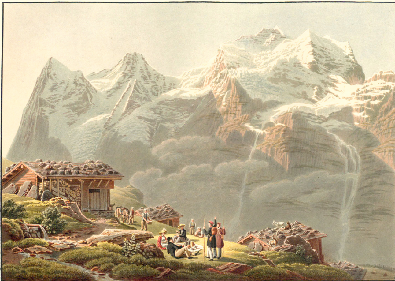
LE PASSAGE DE LA WENGERNALP.

Лазурным пламенем сияют небеса... Как ясен зимний день, как восхищают взоры В безбрежной высоте изваянные горы, — Титанов снеговых полярная краса! На скатах их, как сеть, чернеются леса, И белые поля сквозят в ее узоры, А выше, точно рать, бредет на косогоры Темно-зеленых пихт и елей полоса. Зовет их горный мир, зовут снегов пустыни, И тянет к ним уйти, – быть вольным, как дикарь, И целый день дышать морозом на вершине. Уйти и чувствовать, что ты – пигмей и царь, Что над тобой, как храм, воздвигся купол синий И блещет Зильберггорн, как ледяной алтарь!