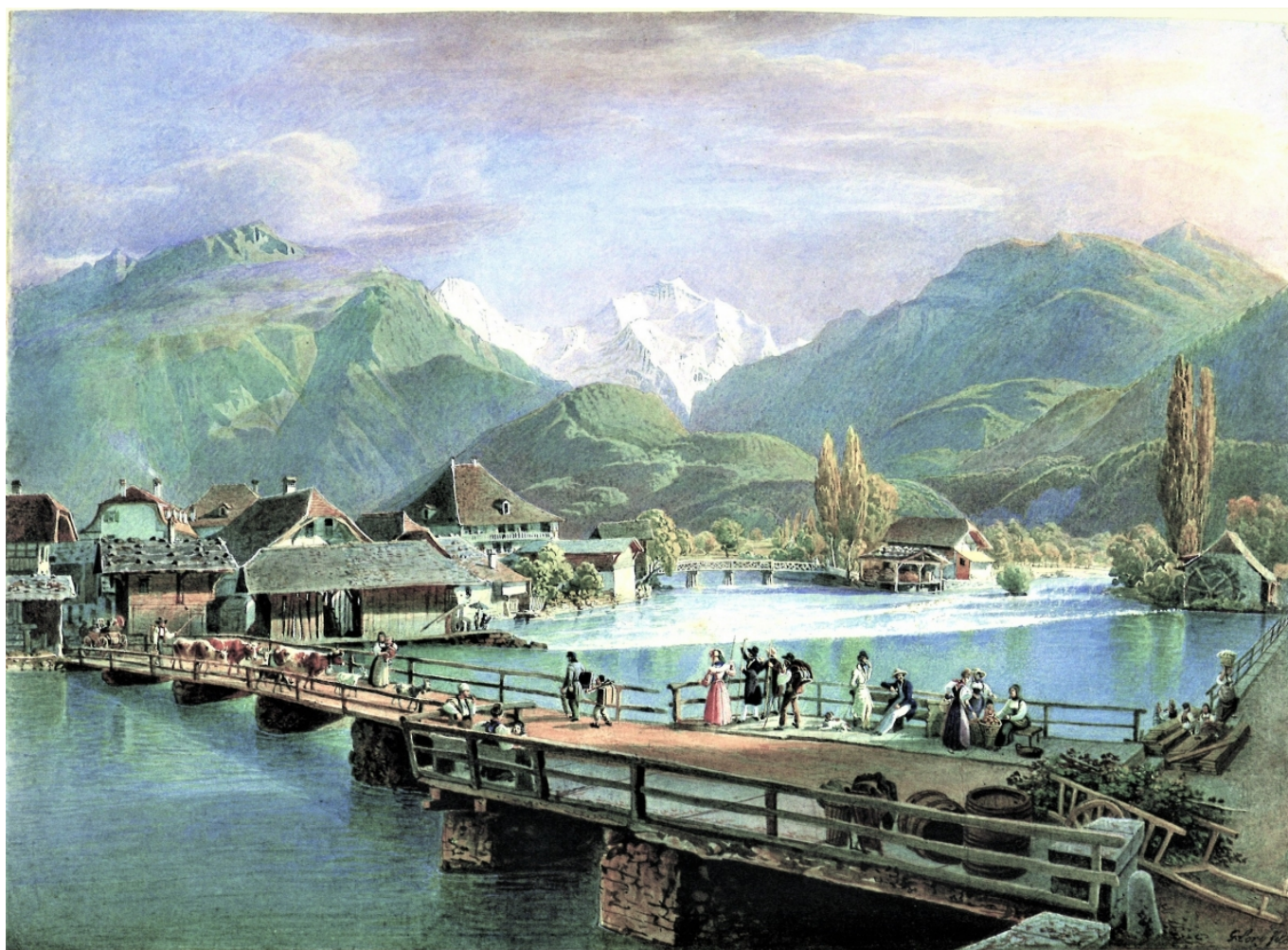
Gabriel Lory fils: Ansicht von Unterseen mit Blick auf die Jungfrau.