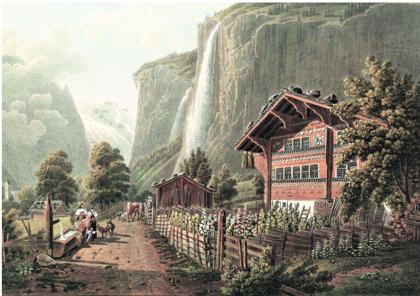
Gabriel Lory fils/Johann Hürlimann: Chûte du Staubbach prise à l'entrée du village de Lauterbrunne.

Author: Наталья Беглова, Женева , 05.06.2020.