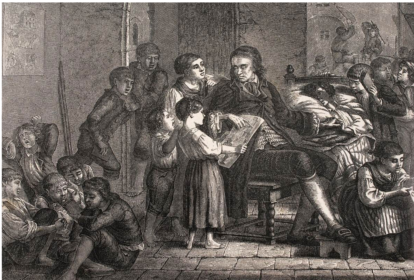
Песталоцци в окружении детей. Старинная гравюра.