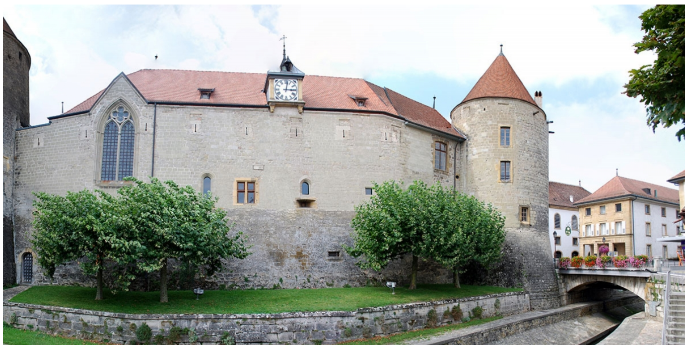
В этом замке находился Ивердонский институт Песталоцци

Очередной крах, но Песталоцци и на сей раз не сдается. С помощью друзей, в 1800 году, он устраивается на работу в школу города Бургдорф, в кантоне Берн, где получает возможность начать преподавание по своей методике. Успехи его учеников настолько очевидны, что в итоге, совместно с горсткой единомышленников, он открывает Педагогический институт. В 1804 году Песталоцци был вынужден в очередной раз переезжать, поскольку замок в Бургдорфе понадобился Бернским властям, но его институт пользовался уже такой известностью, что сразу несколько кантонов предложили ему помещения.