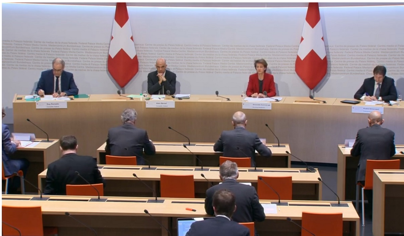
Скриншот трансляции пресс-конференции Федерального совета от 8 апреля

С учетом развития эпидемиологической обстановки и рекомендаций ученых Федеральный совет принял решение о продлении срока действия мер борьбы с эпидемией коронавируса еще на одну неделю – до 26 апреля. Вы можете отреагировать на это решение, приняв участие в нашем опросе . Ограничения постепенно начнут снимать в конце месяца, отмечается в правительственном КОММЮНИКЕ . Правительство поручило департаментам здравоохранения и экономики разработать концепцию поэтапного ослабления мер, которая будет представлена 16 апреля. При принятии решения о выходе из lockdown власти будут учитывать ряд критериев, в частности, количество новых случаев заражения, число госпитализаций и показатели смертности. Решающее значение будет иметь и то, соблюдаются ли меры гигиены и рекомендации по социальному дистанцированию. Напомним, что в Швейцарии не введен строгий карантин, но власти постоянно напоминают людям о необходимости оставаться дома.