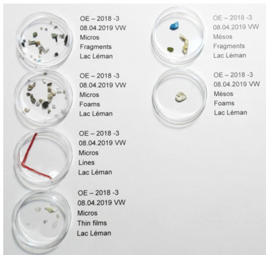
Образцы пластика, плавающего на поверхности Лемана

поступает в Женевское озеро из очистных сооружений и загрязненных рек, например, синтетические текстильные волокна могут попадать в стоковые воды из стиральных машин. Кроме того, свой вклад вносит и ветер, который переносит пластик во время сильных бурь или гроз.