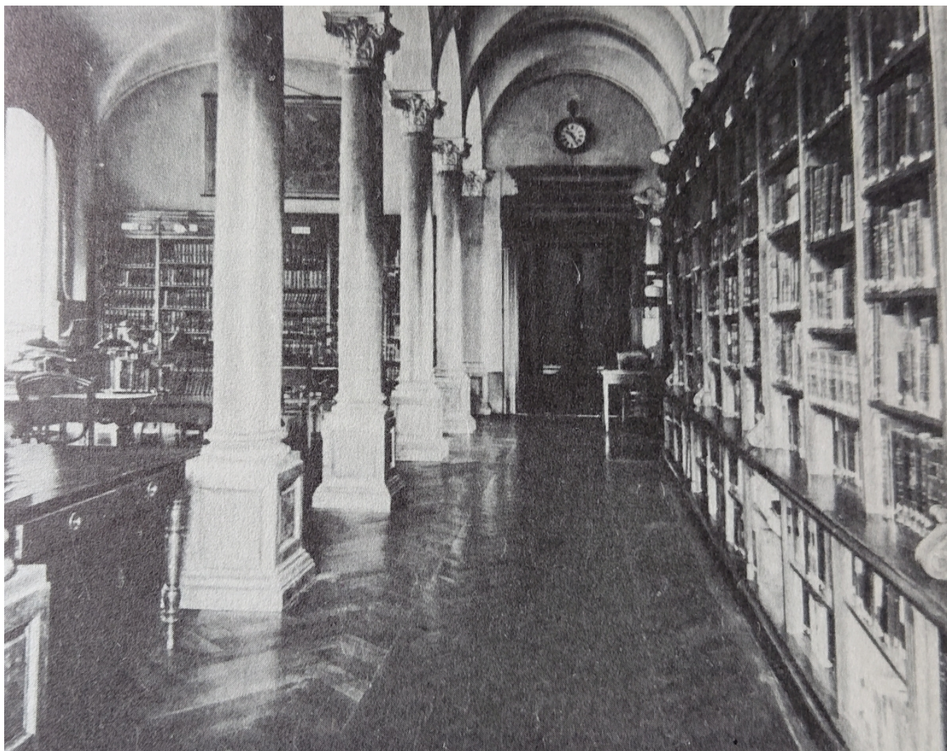
Читальный зал архива не позднее конца 1960-х - начала 1970-х годов.

Автор так бы и продолжал беспомощно разводить руками перед собеседниками, если бы на помощь не пришёл, уже лет десять назад, удивительный, богатейший, великолепный, неожиданный Федеральный архив Швейцарии!