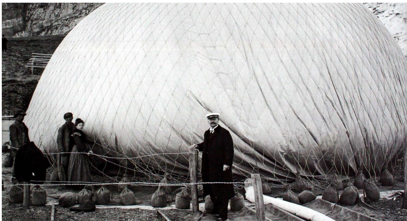
Эдуард Спелтерини перед воздушным шаром, 1904 год.

Певческая карьера Эдуарада прервалась из-за пневмонии, и в возрасте 18 лет он сменил род деятельности, поступив в Академию воздухоплавания в Париже, где освоил управление воздушным шаром. В 1887 году он приобрел собственный шар «Урания» и начал путешествовать по миру, предлагая коммерческие полеты. Внимание публики он привлекал с помощью трюков воздушного акробата, а благосклонность прессы завоевал тем, что предлагал журналистам бесплатные полеты.