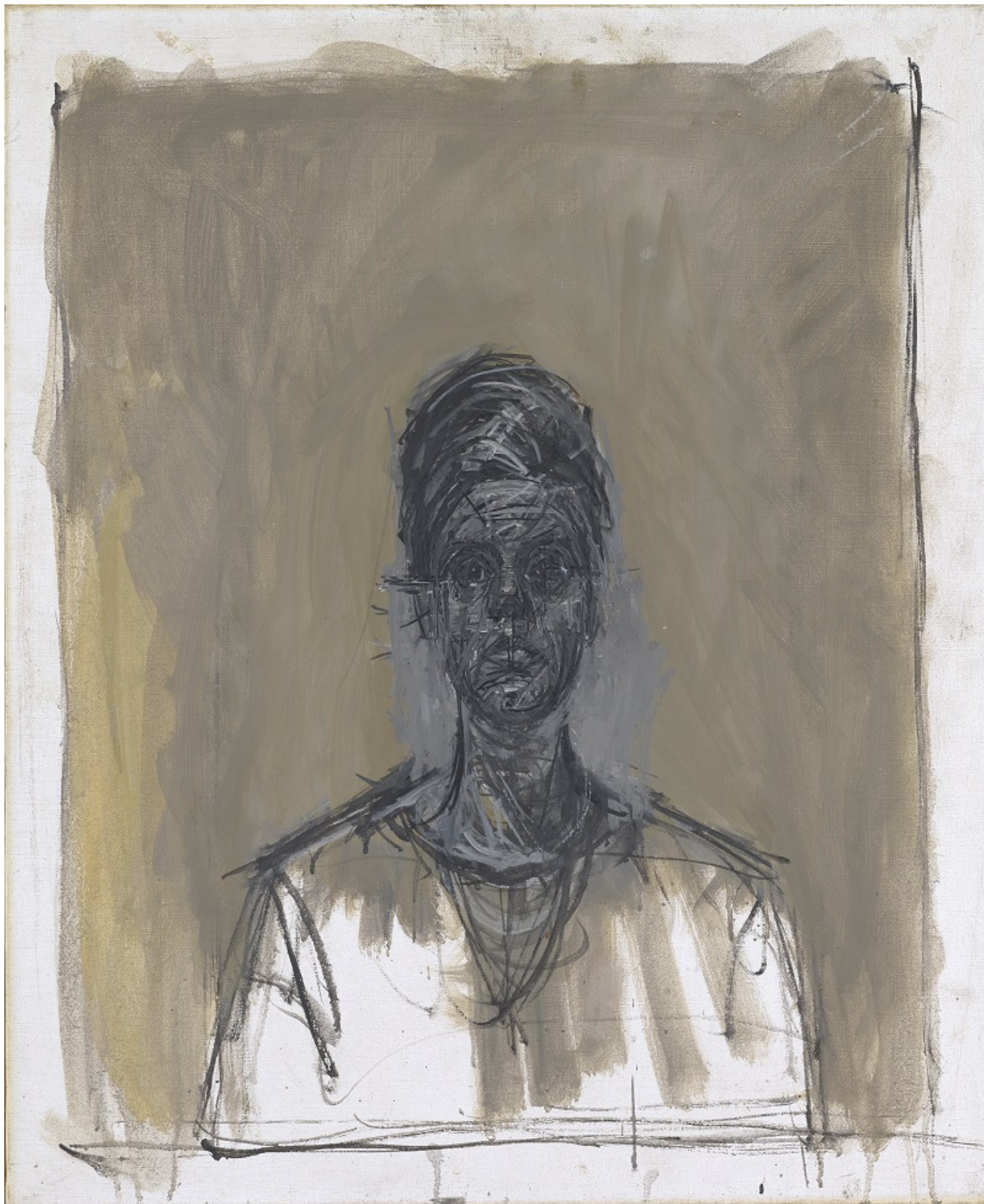
«Портрет Каролины», Альберто Джакометти, 1962 г.