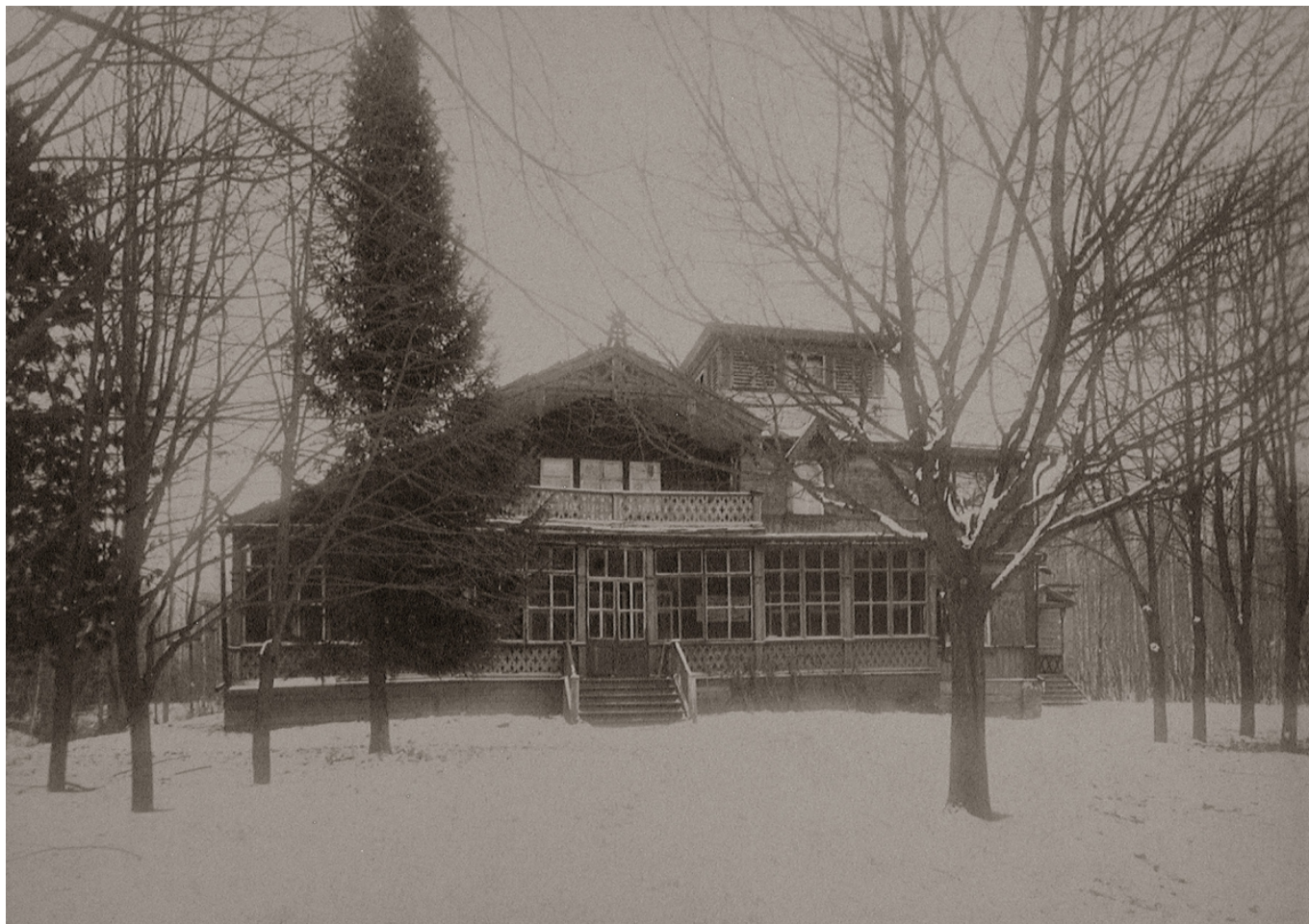
Подмосковное Майданово, где П. И. Чайковский работал над «Иолантой»

Во время пребывания в США, где с триумфом шли его гастролы, настроение Чайковского меняется. По дороге на Ниагарский водопад он вновь пишет брату Модесту 29 апреля (11 мая) 1891 года: