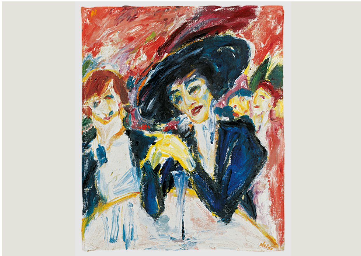
"За столиком с вином", Эмиль Нольде, 1911

писал по-другому». А объединяло их стремление порвать с академизмом, выйти за рамки традиционного искусства и найти свой художественный язык. Они оба интересовались всем экзотичным, фантастичным и гротескным. На этих трех темах в творчестве Нольде Центр Пауля Клее и сделал акцент.