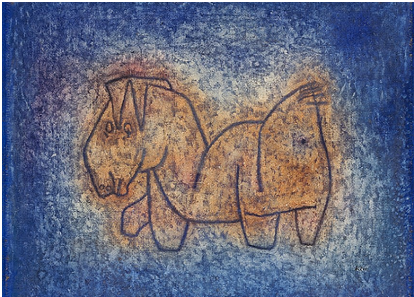
Paul Klee, Bastard, 1939