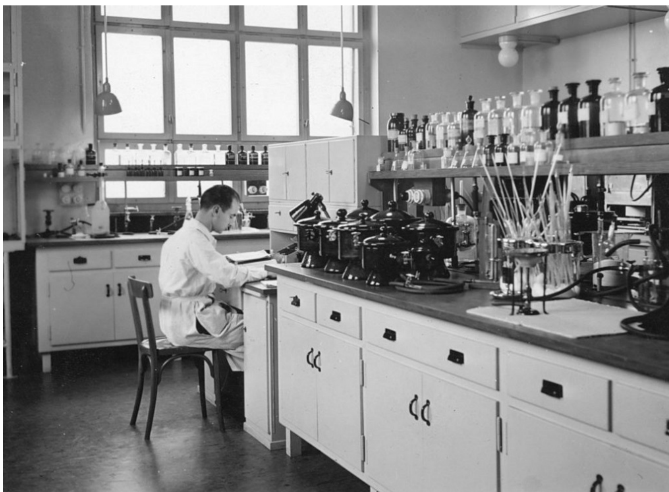
Альберт Хофманн в лаборатории

Author: Зарина Салимова, Берн , 10.09.2018.