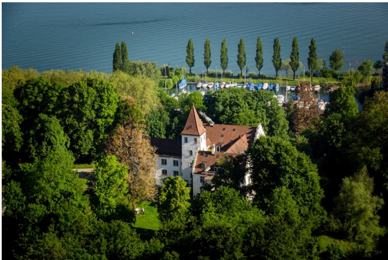
Замок Вартегг.

Почти все отмеченные премией конгресс-центры представляют собой современные здания из стекла и бетона. Но одно исключение все же есть – это интерлакенский курзал. Его возвели в 1859 году, и все это время он используется по назначению: как театр, бальный или концертный зал, казино и место для проведения конференций и лекций.