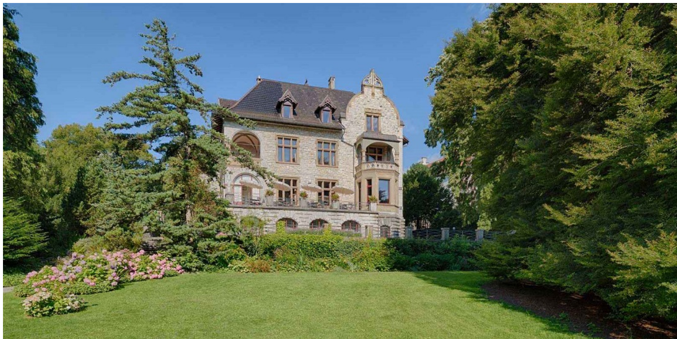
Вилла Boveri.

Самым красивым местом для проведения конференций и семинаров признан отель Vosken в Хоргене – настоящее поместье недалеко от Цюриха. Его история восходит к XIII веку: в разное время здесь располагались таверна, частная загородная резиденция цюрихского бургомистра, курорт и школа для девочек. На втором месте – замок Хюниген в Конольфингене. Хюниген впервые упоминается в XII веке, но сохранившееся до наших дней здание было построено позже – в XVI веке. Более трех столетий замок находился во владении семьи успешных коммерсантов фон Мей, связанных родственными узами со многими знатными бернскими фамилиями. В 1892 году они продали часть земли Сезару Рицу. «Король отелей и отельеров» и основатель империи Ritz открыл в Конольфингене фабрику по производству сгущенного и порошкового молока. Фабрика принадлежит сейчас Nestlé, а в замке открылся отель.