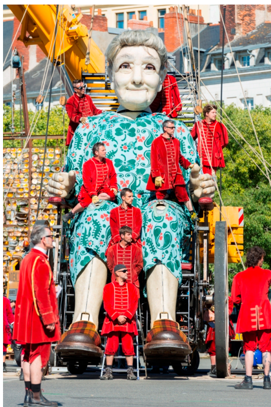
Бабушка и ее лилипуты

Лицо статуи – из силикона, волосы и брови – из конских волос. Один только ее шиньон весит 12 килограмм. Вес Бабушки – 1 787 килограмм. В движение ее приводят 25 «лилипотов» в бордовых одеждах. В таком возрасте и при таком весе ходить старушке нелегко: за час она преодолевает 1,2 километра. Если же она сядет в любимое кресло-каталку весом 5 тонн, то за то же время может проехать 3 километра, отмечается на сайте будущего представления.