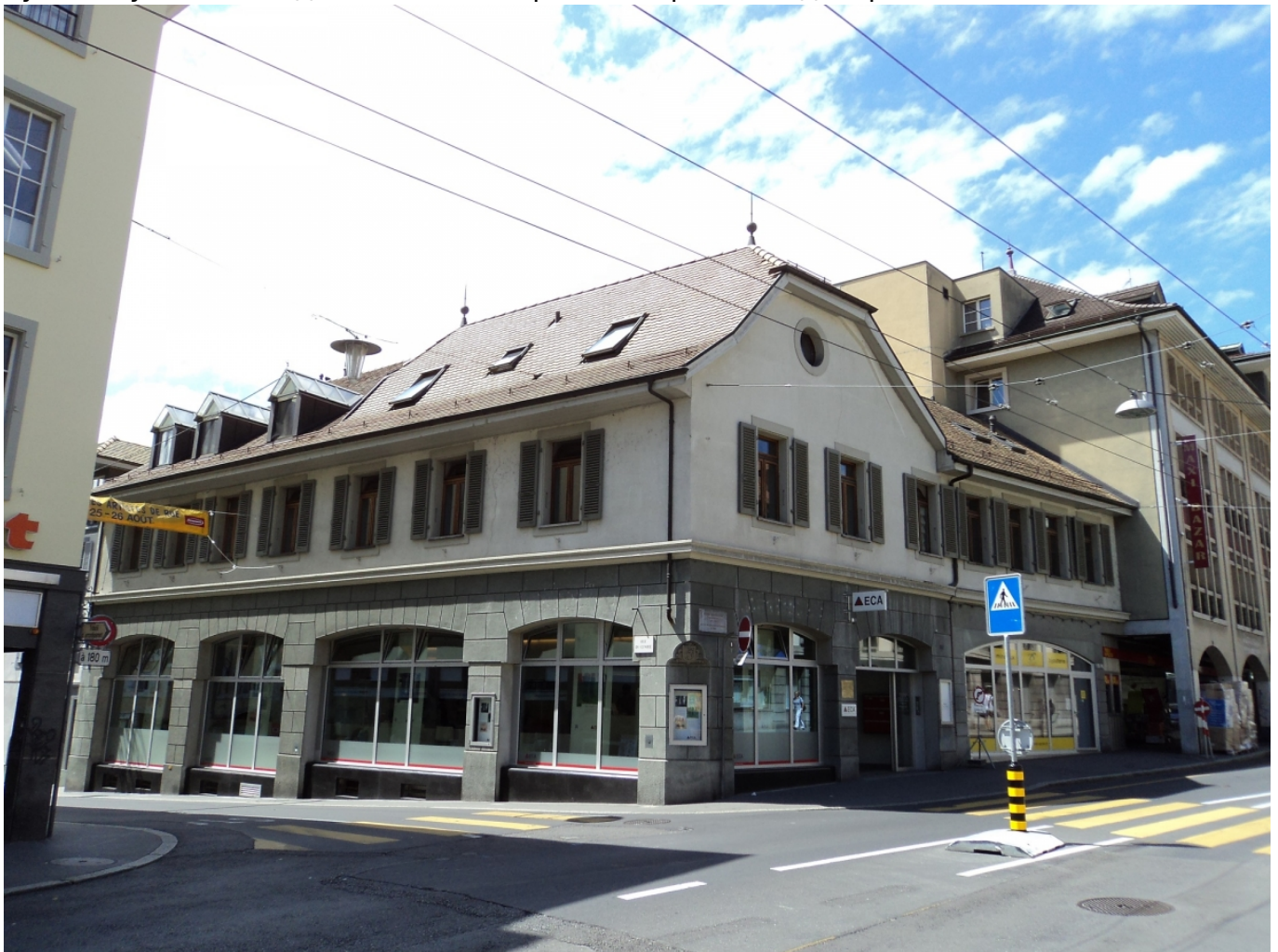
Дом Достоевского в 2010-е годы.

Но вышеприведённые строки сопровождаются в том же письме следующими: «Вот уже месяц как мы в Вевее – городишка дрянной, в 4000 жителей, и по несчастью нашему опять в дрянь попали (всё мне здесь гадко!). Не люблю я этой уединённой жизни, в углу; за границей хорошо поехать по большим городам и по хорошим местам мимоходом, а постоянно жить тяжело». <...> Но скверно то, что в Вевее раздражаются нервы, и скоро предрекают сильные жары (а мне именно в это время надо будет работать). Гулять есть где, если захочешь, а купаться опять-таки нельзя: признано докторами, что озерная вода расслабляет организм. Наконец, газет русских нет в Женеве, а для меня это очень важно. Книжная лавка одна. Галерей, музеев и духу нет; Бронницы или Зарайск! – вот Вам Вевей. Но Зарайск, разумеется, и богаче и лучше. Тут только один из самых первых в Европе ландшафтов и больше ничего».