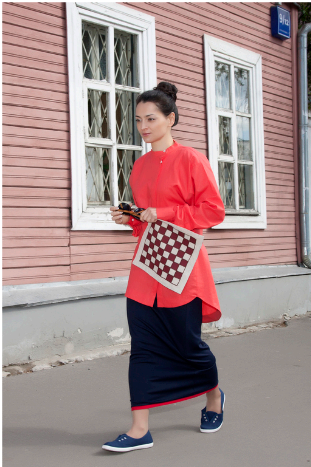
Шахматы с Александрой Костенюк - очень модная игра!

Фойе ВОИС было преобразовано в подиум, на котором демонстрировались известные молодому поколению наших соотечественников лишь по картинам пальто-армяки, косоворотки, порты и платья-вортунки, которые всем нам предлагается носить в сезон осень-зима 2017/18 годов. Интересно, что на фотосессию в одежде Feodora, прошедшую на старых московских улочках, согласилась даже двенадцатая чемпионка мира по шахматам, двукратная чемпионка России (2005, 2016), чемпионка Европы (2004), чемпионка Швейцарии (2011), трёхкратная победительница шахматной олимпиады (2010, 2012, 2014) и четырёхкратная победительница командного чемпионата Европы (2007, 2009, 2011, 2015) в составе команды России Александра Костенюк . А в Женеве помимо профессиональных манекенщиц из