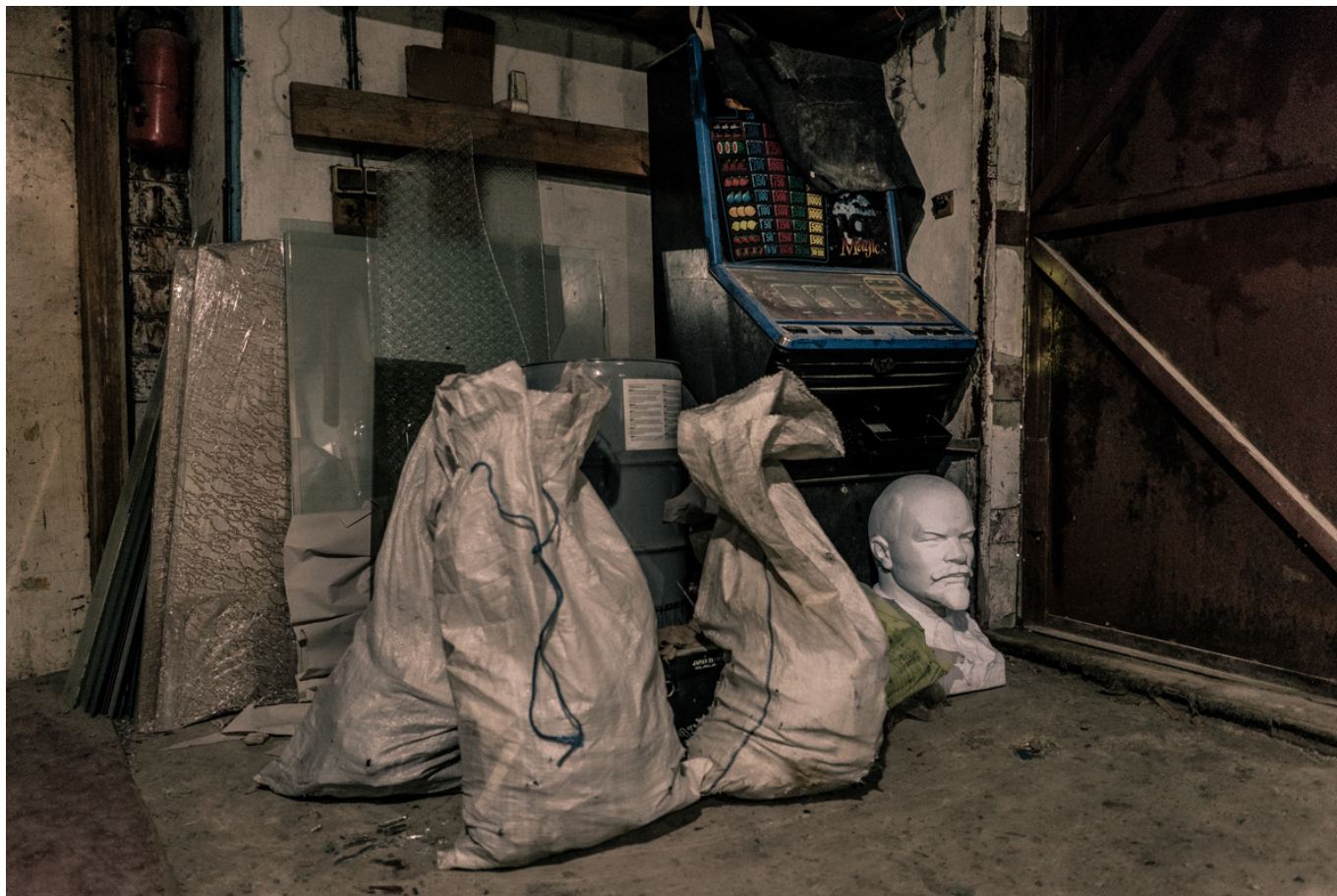
Харьков, 2 февраля 2016 г.

«Мы не ставили перед собой цель понять все, - делится Себастьян Гобер. - Речь шла о том, чтобы узнать, понаблюдать, прислушаться. Покрытые тенью зоны декоммунизации вписываются в бурную историю страны, переживающей глубокую трансформацию. Какой смысл придадут украинцы собственной истории? Каким образом разрыв с коммунистическим прошлым может повлиять на их национальную идею? В этой стране многое нуждается в изучении. Падение Ленина – это только начало». В ходе своего расследования Нильс Аккерманн и Себастьян Гобер обнаружили многочисленных Лениных в самых неожиданных местах: в садах и парках, на свалках, в коридорах музеев, в частных квартирах. Их находки запечатлены в беседах с владельцами или хранителями, а также в чудесных фотографиях – странных, с сумасшедшинкой, а порой с налетом ностальгии. Некоторые Ленины восстановлены, другие преобразованы в Дарта Вейдера, центрального персонажа Вселенной «Звёздных войн», в казака или человека-сэндвич. К этим ставшим совершенно безобидным предметам население испытывает радикально противоположные чувства – от определенной нежности до яростной ненависти. Ясно одно, «они – признак неудобного прошлого, от которого надо избавиться, чтобы вообразить будущее Украины».