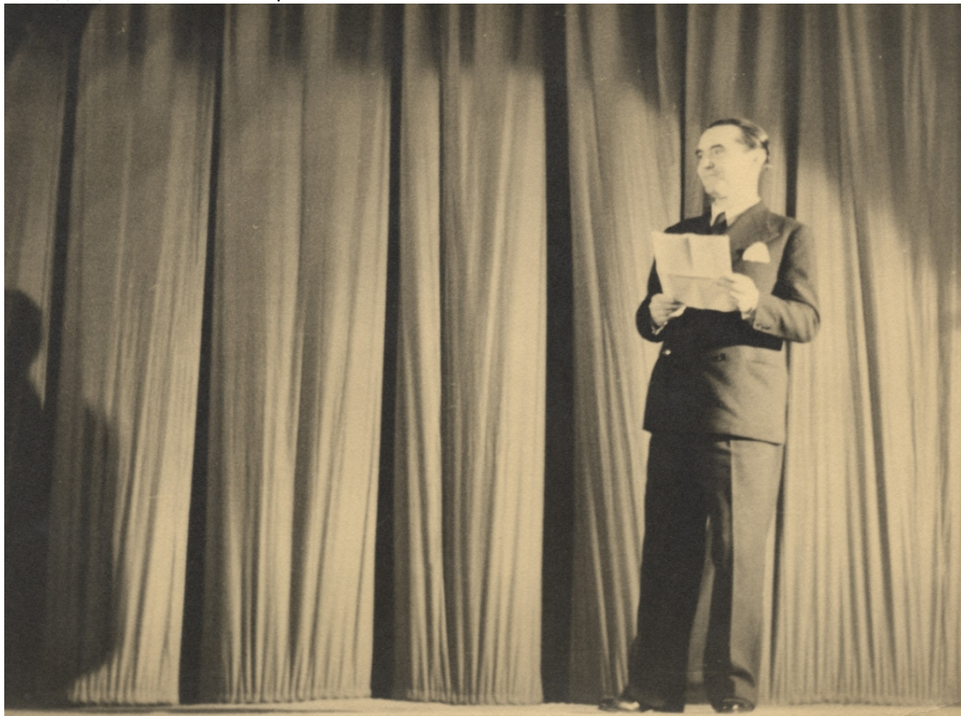
Федерико Гарсиа Лорка на спектакле по пьесе Лопе де Вега «Дурочка» в Театре Барселоны, 10 сентября 1935 г.

Выставка, открывающаяся завтра в Библиотеке Фонда Яна Михальского, регулярно радующего нас интересными и познавательными проектами, ограничена театральной составляющей творчества Федерико Гарсиа Лорки, для которого характерны пять ключевых тем: любовь, отчаянный поиск любви и разочарование как неизбежное его следствие; одиночество, в которое погружаются его персонажи; маска, как ханжеская защита; театр, как большая метафора лжи; и, наконец, смерть, находящаяся в вечном противостоянии с жизнью.