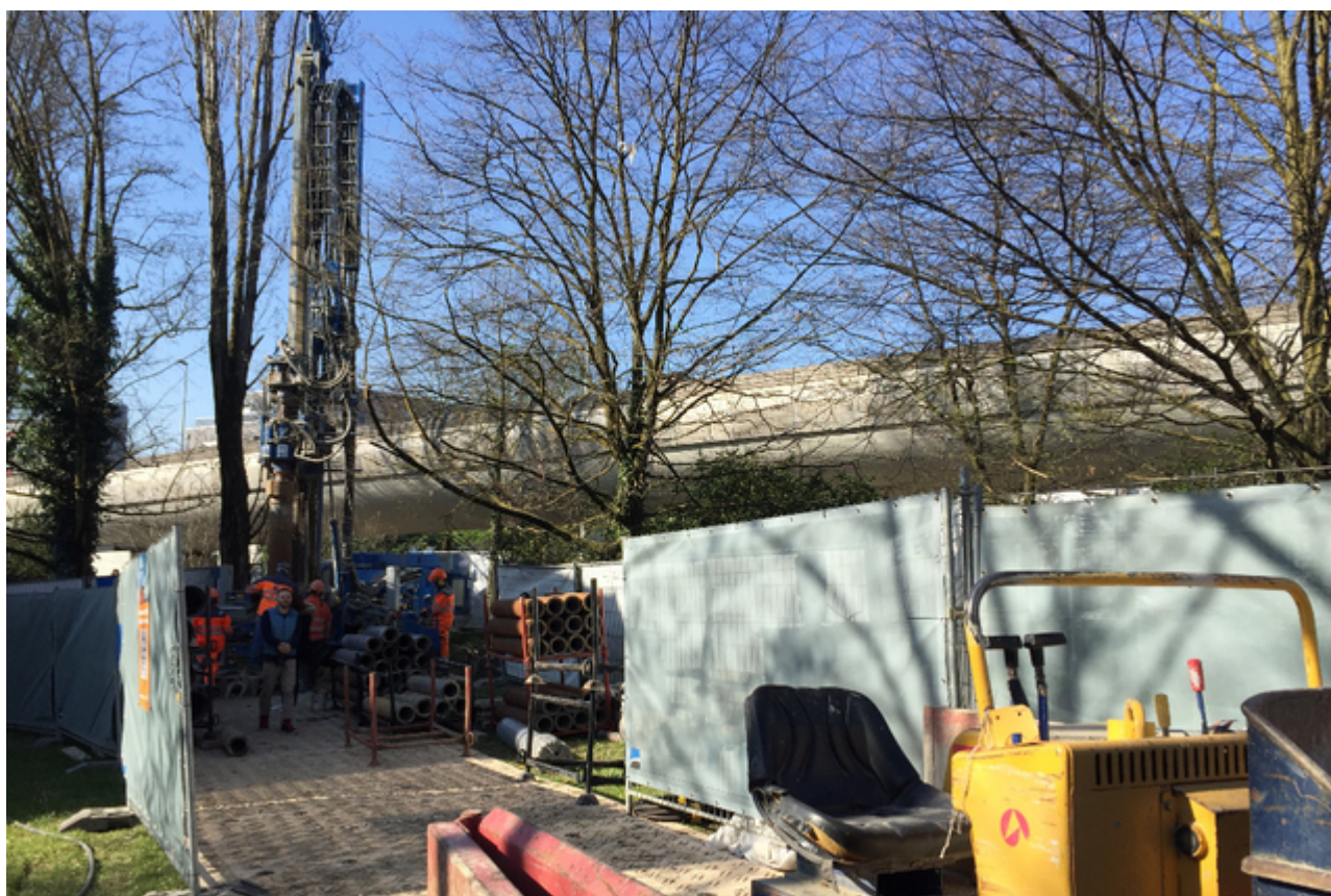
Начало работ в Вернье

Низкая рентабельность, риск землетрясений – эти факторы не должны послужить поводом для полного отказа от изучения перспектив этого направления энергетики, считают авторы исследования , проведенного Центром оценки технологического выбора TA-Swiss. Женева, власти которой активно поддерживают как словами, так и финансированием использование местных и возобновляемых («зеленых») источников энергии, в последнее время активно претворяет в жизнь свою энергетическую стратегию. Недавно мы рассказывали о том, что крыши зданий, принадлежащих кантону, будут использоваться для производства солнечной энергии. Новый проект, реализуемый в рамках кантональной программы GEothermie 2020, заключается в развитии так называемой «приповерхностной геотермии». Речь идет о грунтовых водах, которые залегают всего в нескольких десятках метров от поверхности земли.