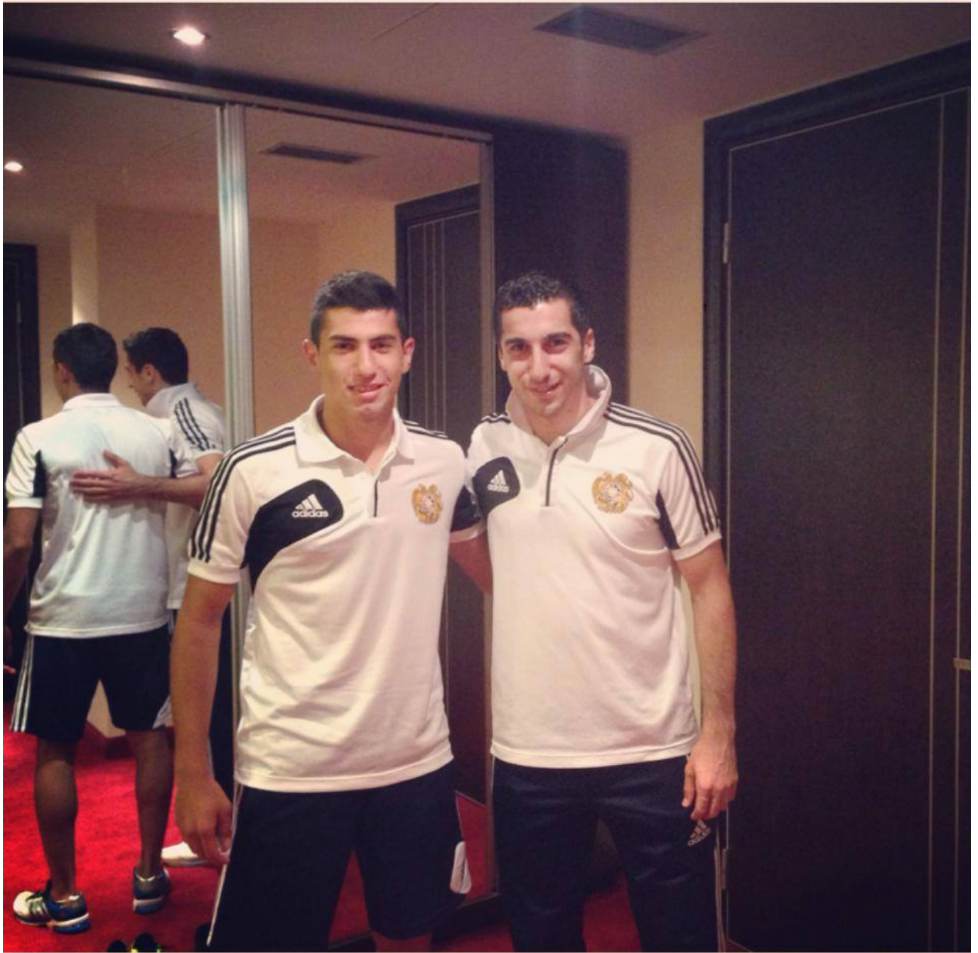
Артем Симонян и Генрих Мхитарян в сборной Армении

Скажи, пожалуйста, есть ли футболисты, играющие на твоей позиции, на которых ты стараешься равняться? Возможно, твои любимые игроки?