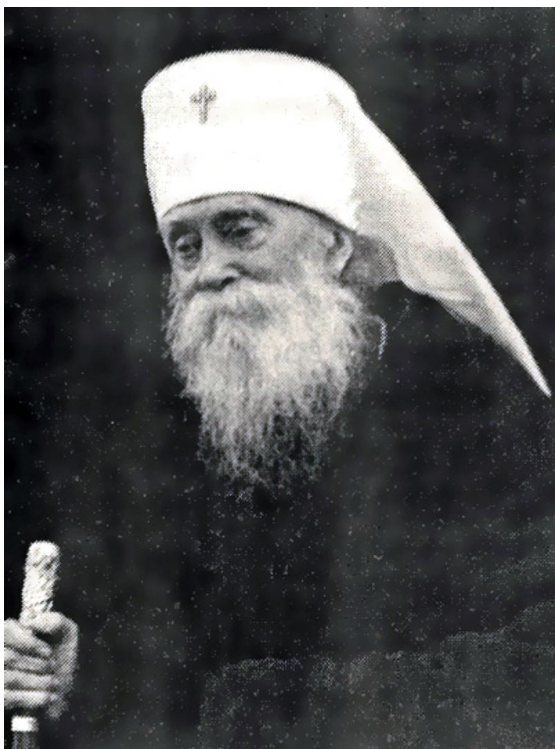
Митрополит Анастасий (Грибановский).

Но обо всем по порядку. Не желая заводить читателя светского издания в дебри церковной истории XX века, скажем только, что это были времена, когда противостояние белых и красных отразилось и на некогда единой Российской Церкви Императорской России, породив размежевание и вражду. Русская Православная Церковь Заграницей, объединявшая церковную диаспору на всех континентах, на момент окончания войны лишилась своего обустроенного и любимого центра в Югославии, куда тоже вошла Советская Армия. Архиерейский Синод и церковная администрация временно пребывали в Германии и начинали готовить переезд за океан. Между разрушенной войной Европой, с одной стороны, пугавшей всех с Востока советской мощью с другой, и далекой Америкой с третьей находился островок стабильности и безопасности – Швейцария, с Женевой и ее старым добрым Крестовоздвиженским собором .