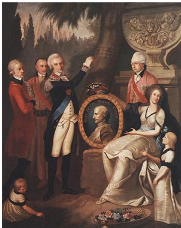
Семейный портрет Прозоров, 1800 г.

А как назвать совершенно непонятный визит всего семейства в Монтре? Выяснилось, что на городском кладбище была похоронена девушка – первая любовь графа. Так вот, он не только сам отправился на ее могилу, но прихватил с собой свою жену и даже детей!