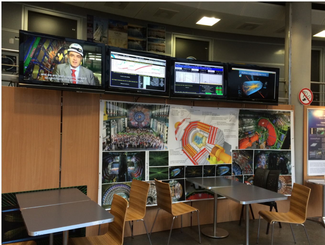
Новости из недр коллайдера

Однако все это требует финансирования, в то время как до последнего момента не было очевидно, что членский взнос будет уплачен. А будет ли он перечислен через год, через два? Насколько я знаю, в стране сейчас тяжелая финансовая ситуация. В «дорожной карте» как раз говорится о том, что этот проект долгосрочный и платить взносы необходимо постоянно на протяжении многих лет. А нужно ведь не только оплатить взнос, но и послать сюда людей, познакомить их с экспериментом, ввести в курс дела, чтобы они могли внести какой-то вклад, уехать обратно уже с опытом и продолжать участвовать в этой работе удаленно.