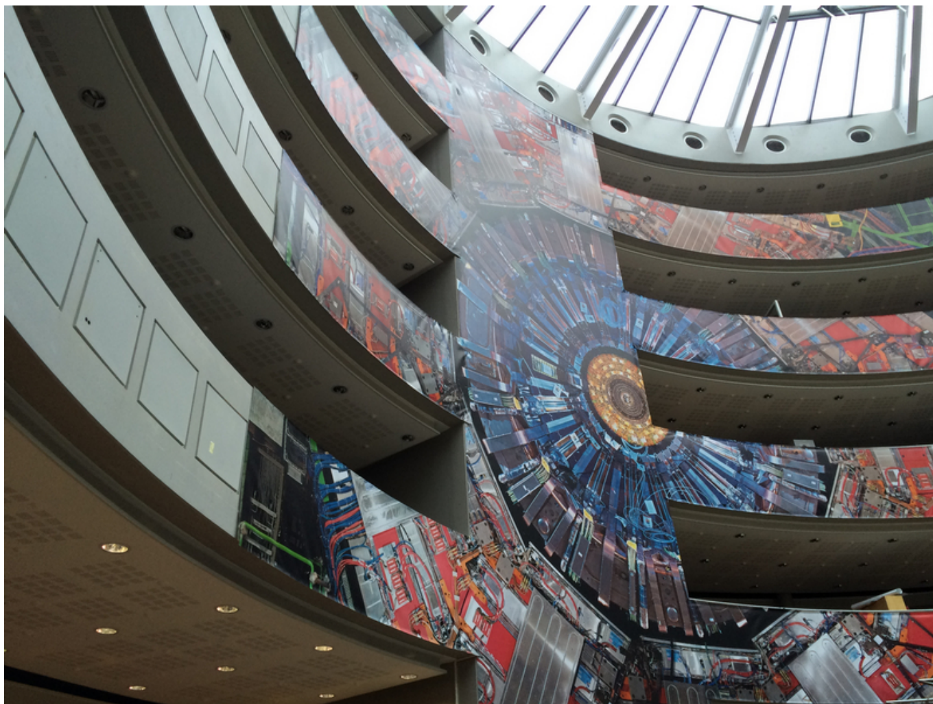
Дизайн здания №40

Кстати, в последнее время мы стали активно использовать в анализе данных методы машинного обучения. Это бурно развивающаяся область: анализ больших данных, машинное обучение, искусственный интеллект. Совместно с сотрудниками из Объединенного института ядерных исследований (ОИЯИ, Дубна) мы решили включить в наше исследование деревья принятия решений, в англоязычной терминологии известные как boosted decision trees (BDT). Мы используем метод BDT для отделения интересующих нас сигнальных частиц от частиц шума. В чем заключается его смысл: на симулированных данных мы сначала «обучаем» компьютер отличать один тип частиц от очень похожего, но все же другого типа. В процессе обучения происходит построение деревьев и фиксация их параметров путем многократной подачи частиц сигнала и шума. Это очень похоже на обучение человека. Допустим, вам говорят: «Вот машина, у нее есть четыре колеса, мотор, кузов и так далее». Потом, когда алгоритм «натренировался», мы запускаем его на реальных данных, которые были собраны на коллайдере. Он начинает отделять сигнал от шума и делает это более эффективно, чем можно было бы это сделать обычными методами.