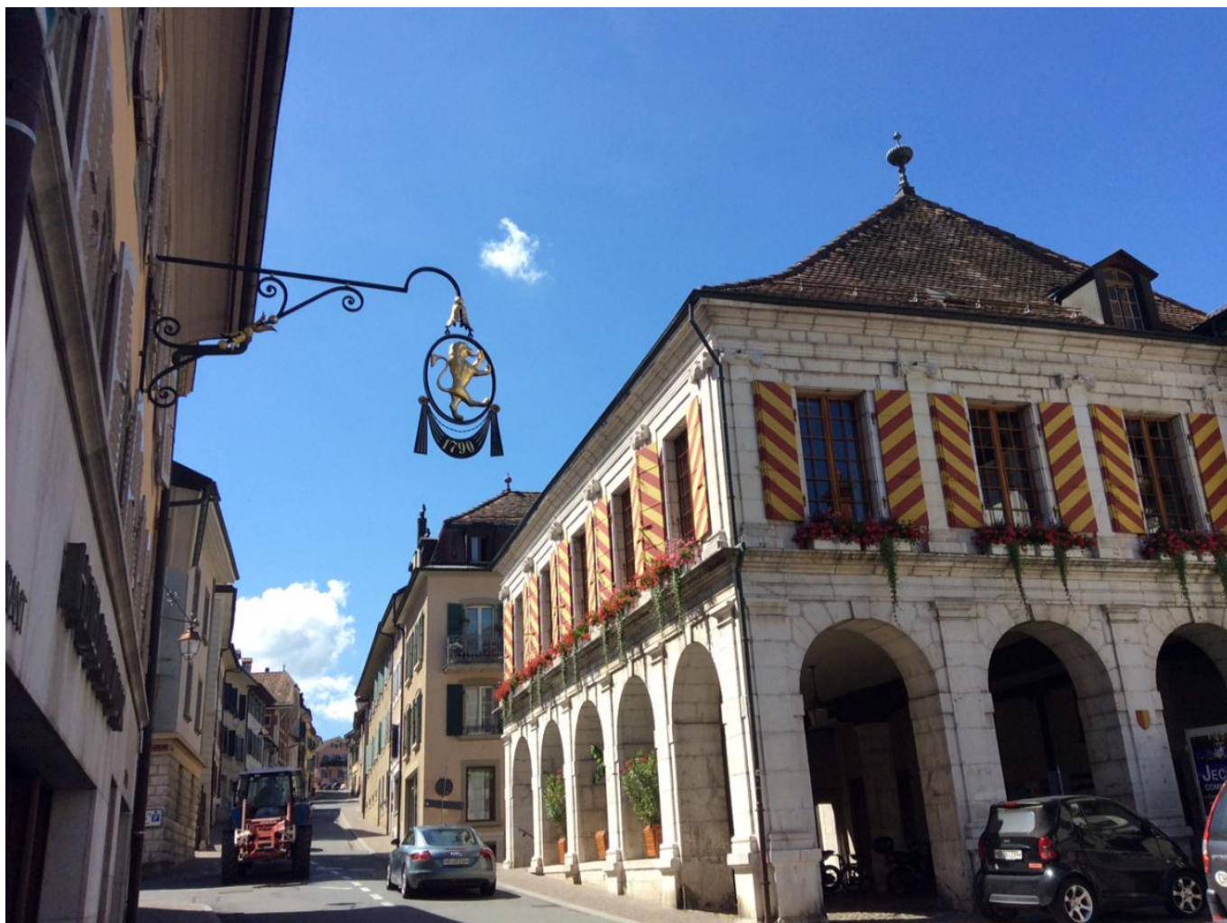
Обонн

Путешествовать Тавернье начал еще подростком, выезжал из Парижа по торговым надобностям, к шестнадцати годам отметился во многих европейских странах, а затем поступил на службу к имперскому наместнику Венгрии и будто бы присутствовал при сражениях против турок. Впоследствии Жан-Батист перешел на службу к мантуанским герцогам Гонзага, но Европа Европой, а греза – грезой. Тавернье мечтал увидеть Восток. В 1630 году 25-летний торговец нашел подходящих спутников-миссионеров, и поплыли они к турецким берегам. Константинополь, Эрзрум, Баку, Исфаган, Багдад, Алеппо – такой была программа этого дерзкого тура, занявшего у Тавернье три года жизни. В 1633 году Жан-Батист вернулся в Париж, привезя с собой роскошные ткани и драгоценные камни, и вскоре после этого, как считается, поступил в распоряжение Гастона Орлеанского. Времена стояли те самые, мушкетерские, воспетые Александром Дюма! Но дома нашему герою не сиделось – он заболел Востоком всерьез и надолго.