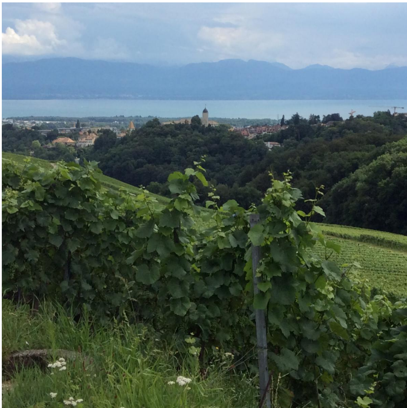
Живописные окрестности Обонна

Новый хозяин повелел снести квадратную постройку 12 века и возвести на ее месте круглую высокую башню а-ля минарет, но с луковичным куполом, как у русских храмов. Эта эклектика была призвана напоминать о восточных вояжах Тавернье, и результатом заказчик остался доволен. Башня и теперь, спустя столетия, привлекает к себе восхищенные взгляды туристов и благодарные – тех, кто заплутал в окрестностях.