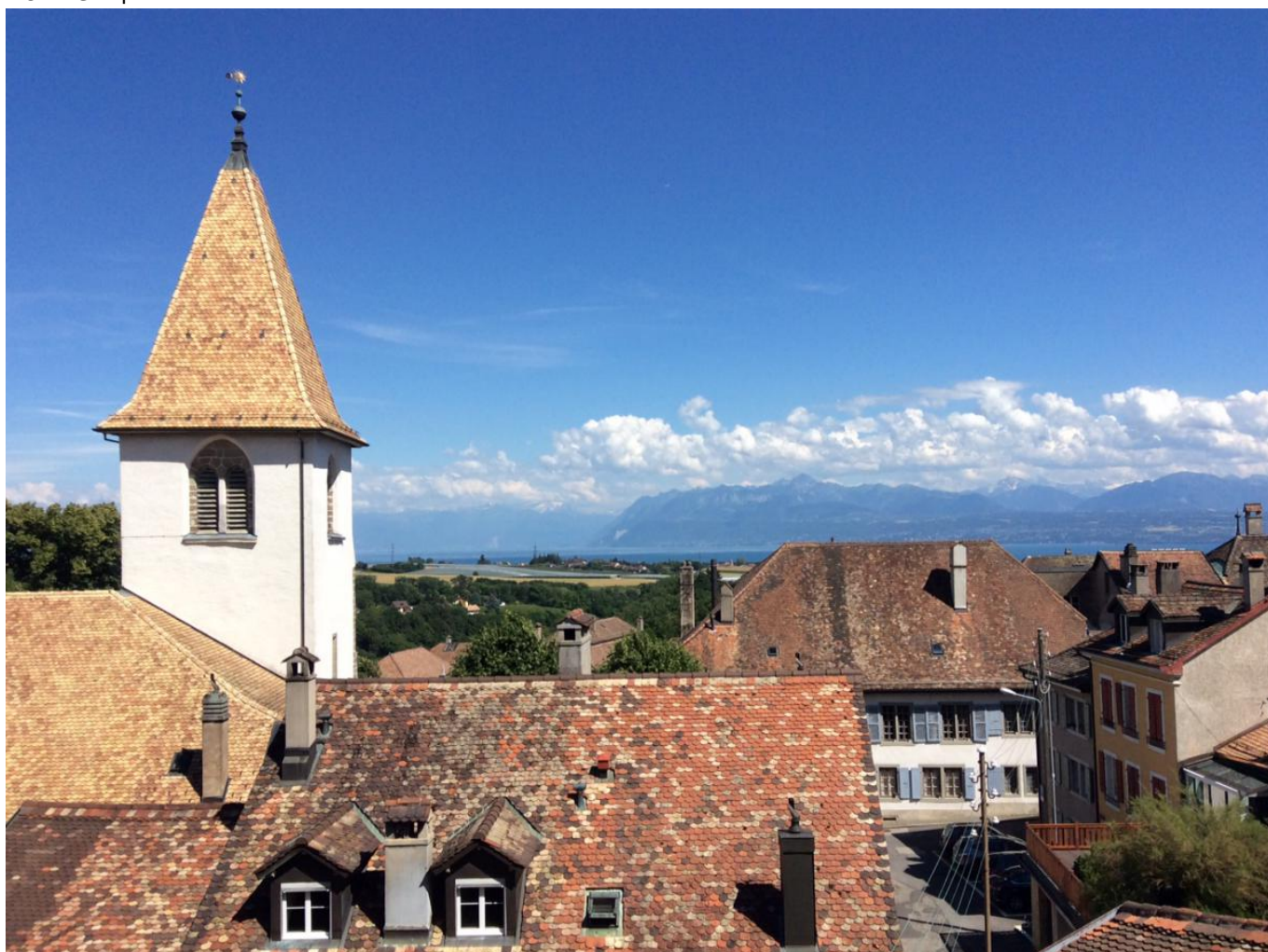
Обонн

Только в 1839 году дивный синий алмаз неожиданно «всплыл» в коллекции британского аристократа Генри Филиппа Хоупа. Несравненная чистота и прочие достоинства камня натолкнули знатоков на мысль о том, что в коллекцию Хоупа попал заново ограненный алмаз французской короны, так как равных ему во всей ювелирной истории мира не было. Так начался «британский» период алмаза, в ходе которого он переходил из одной английской семьи в другую, пока один из владельцев не разорился и уже в XX веке не продал алмаз французскому ювелиру Картье. Тот-то, как считается, и начал распространять слухи о проклятии, которое несет своим владельцам камень Тавернье – сулит и разорение, и супружескую неверность, и прочие напасти. Американского ювелира Гарри Уинстона эти слухи не отпугнули: он владел камнем до 1958 года, а потом подарил его Смитсоновскому институту, где тот пребывает и теперь. И считается истинным бриллиантом коллекции!