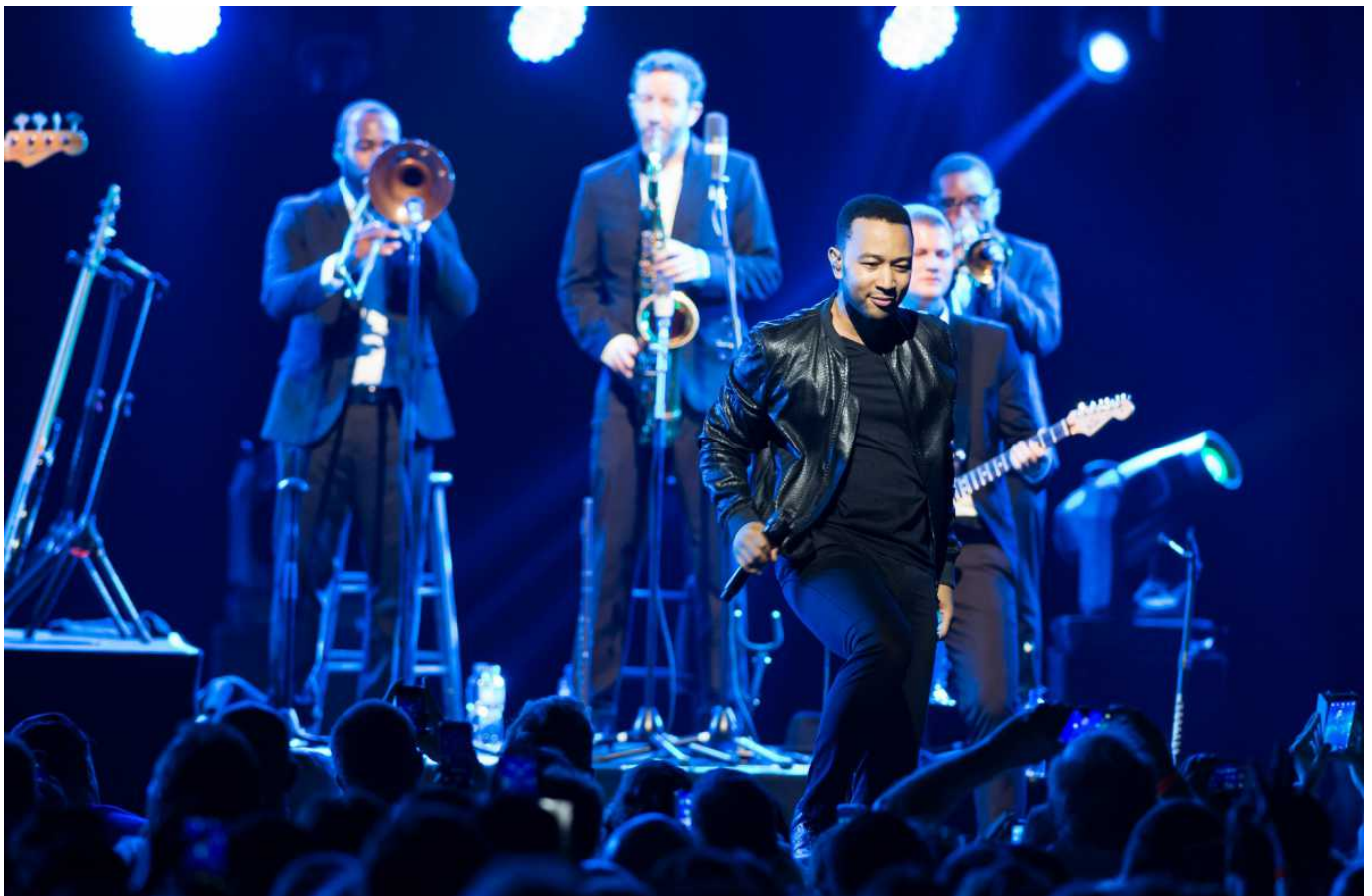
Джон Ледженд

Когда он вышел на сцену в черной кожаной куртке, зал ахнул: при почти сорокоградусной жаре такой шаг казался почти геройским. Первые четыре песни разогрели публику еще сильнее, а затем настал момент, который музыкант продумал заранее. Под гитарное интро он стал медленно снимать с себя куртку, и визги юных поклонниц и их мам наполнили зал. Причем последних было слышно лучше, что неудивительно, ведь основные поклонники фестиваля – люди за 40: в большинстве своем только они могут себе позволить билеты на концерты в Auditorium Stravinski.