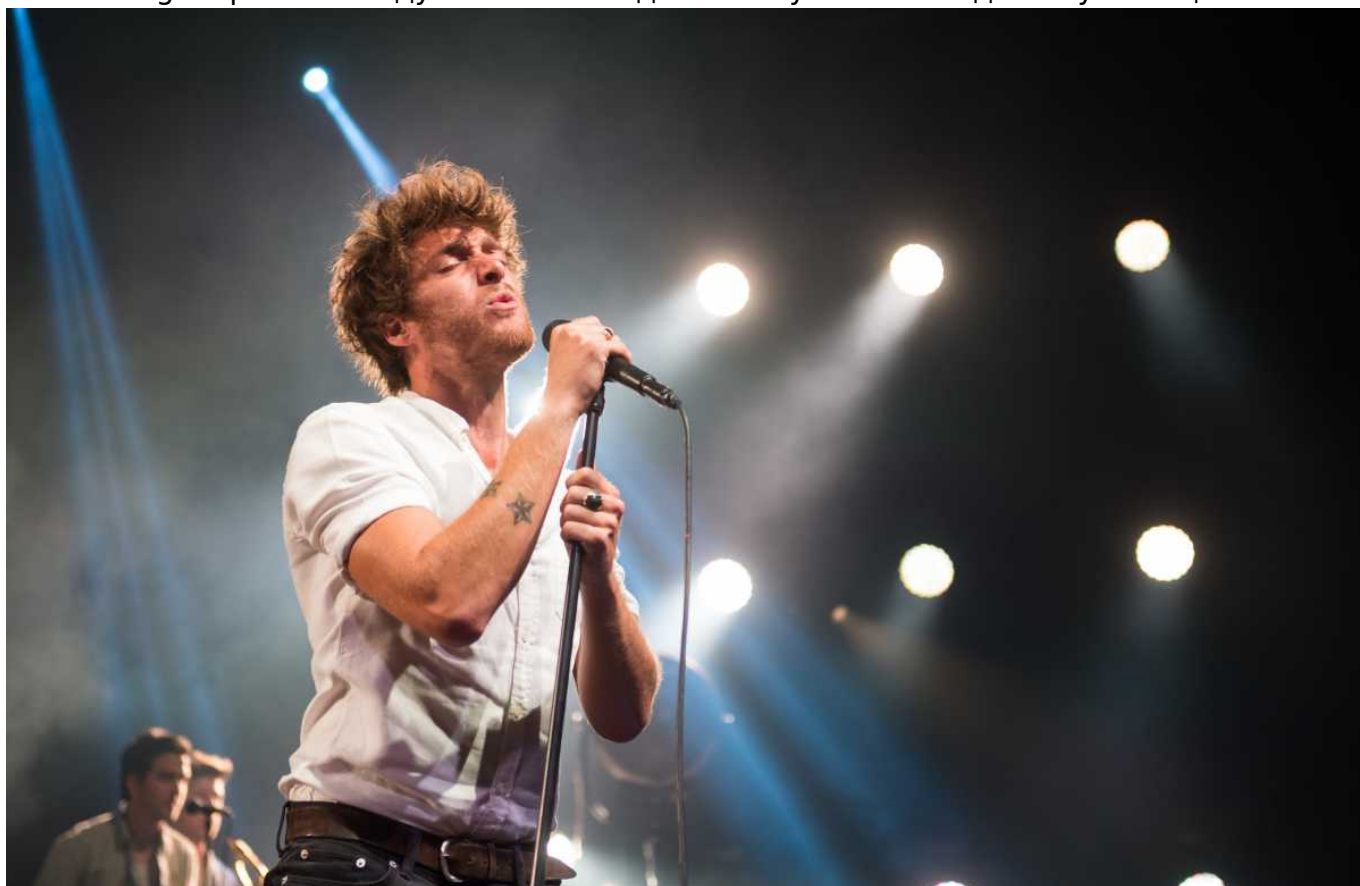
Паоло Нутини

Следом на сцену выскочил любимец школьников и, как ни парадоксально, мэтров соула шотландец с итальянскими корнями Паоло Нутини. Высокие цены на билеты не стали препятствием для толп поклонниц, легко подхватывавших «Iron Sky», «Better Man» и «Cherry Blossom». Нутини заметно отличается от поп-идолов молодежи: качественный вокал, талант сочинителя и аранжировщика сочетаются с даром отличного шоумена с хорошим вкусом. Не зря журнал «Rolling Stone» еще в 2006 году включил его в список десяти самых многообещающих начинающих исполнителей, а Ben E. King в прошлом году назвал его одним из лучших молодых соул-певцов.