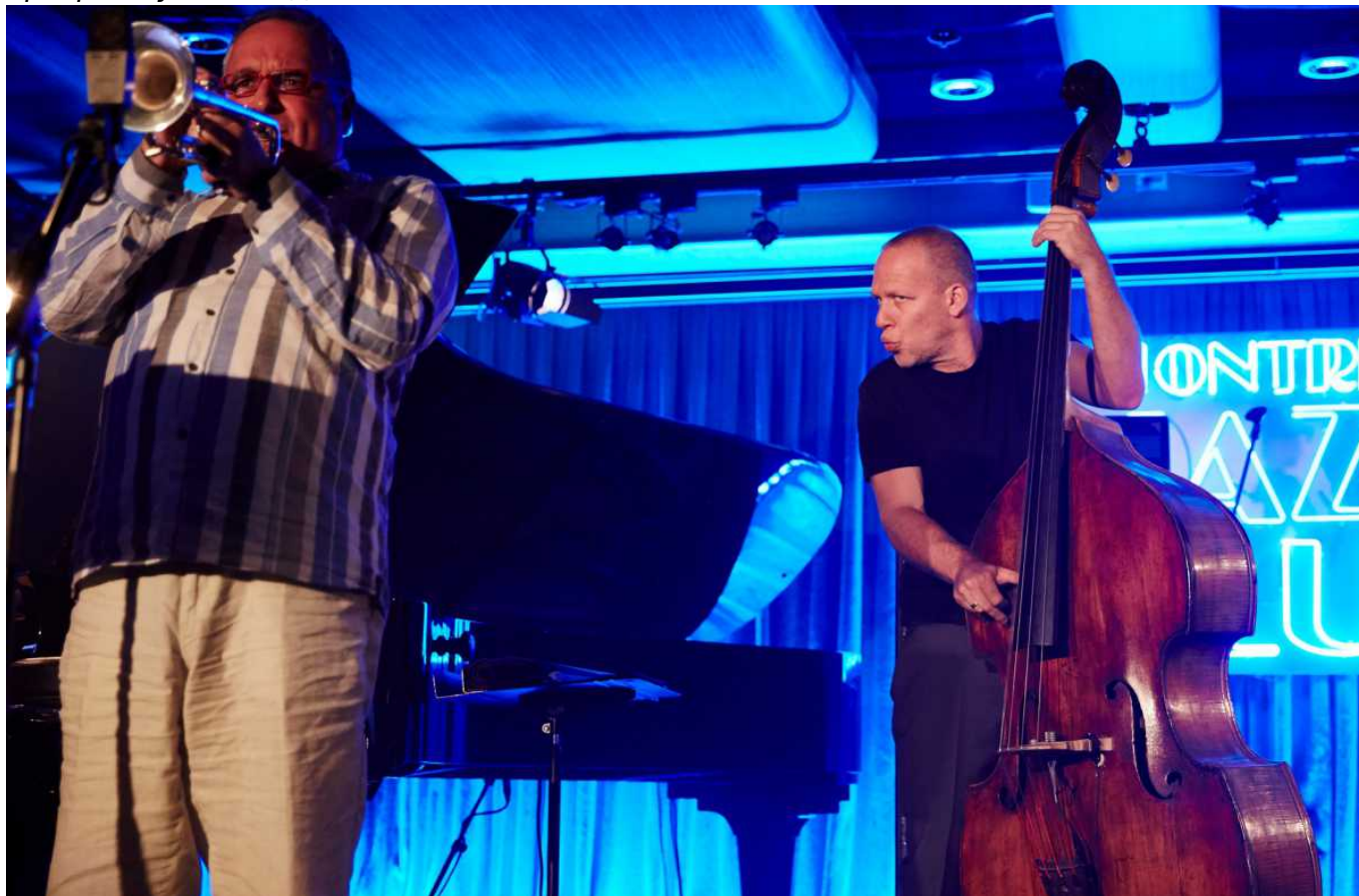
Авишай Коэн и его секстет

До конца фестиваля остается еще пять дней, за которые на сцену поднимутся Сантана, Чик Кореа, The Kooks, Асаф Авидан, Джордж Бенсон и даже Zaz. Полную программу вы найдете на сайте .