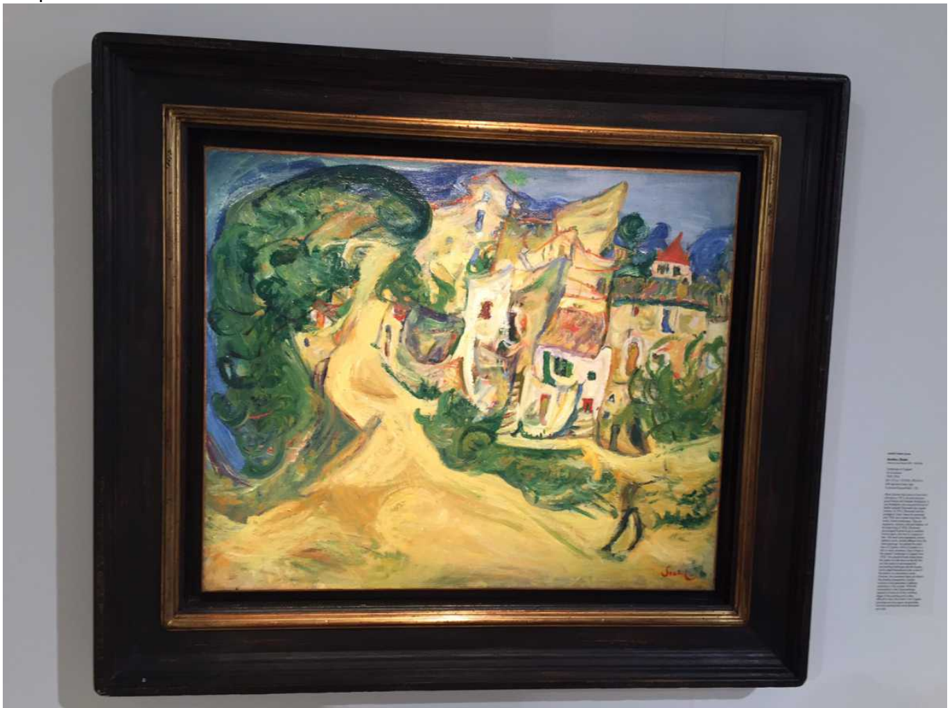
Хаим Сутин "Пейзаж в Кане", Галерея Томас, Мюнхен