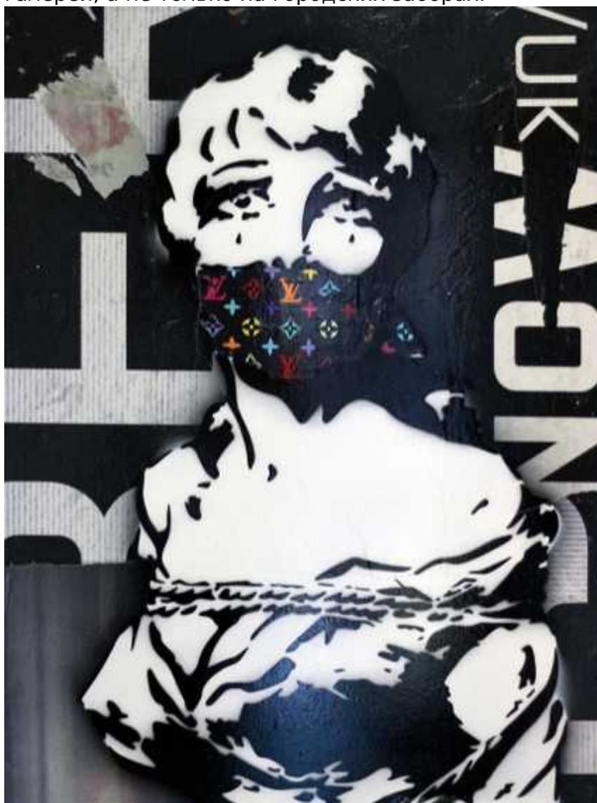
Свобода слова (© Rich Simmons)

Подобные идеи отсылают нас к одному из ключевых принципов уличного искусства, отрицающему строгое следование условным правилам. Отличительной чертой стрит-арта всегда была попытка высмеять общество тотального контроля и потребления. Современные художники, работающие в этом стиле, доказали, что саркастичная критика может быть произведением, место которому в стенах художественных галерей, а не только на городских заборах.