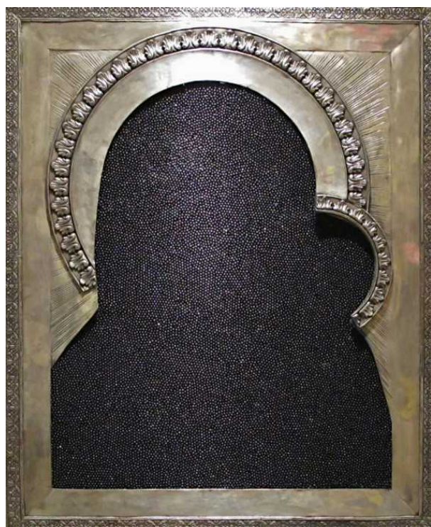
Икона-икра (© Александр Косолапов)

Почти все, что я делал, создавалось в период Холодной войны, постоянного противостояния тех самых систем. Но, если верить Бодрийяру, то все в современном мире – это экономика. Многократно воспроизводимые образы навязываются и продаются, и таких образов хватало в СССР и США. Совмещая их, я пытался придумать новую концепцию перехода. Хотя нечто новое возникало само по себе. Я помню, как в начале девяностых на Пушкинской площади в Москве повесили билборд с кока-колой рядом с недавно открывшимся Макдоналдс.